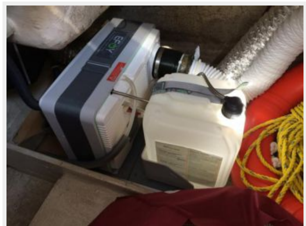
Efoy 210 Fuel Cell Generator