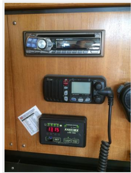
Nav Station VHF w/ remote, Stereo and Inverter Panel