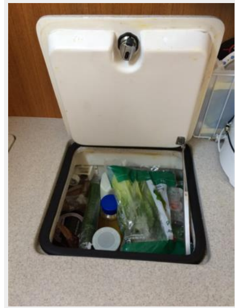
Countertop Access to Fridge