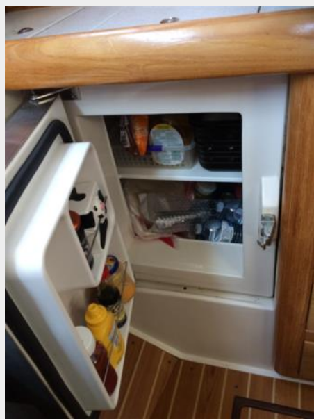
Front access to Fridge