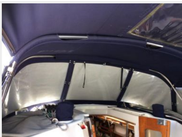
Dodger w/ window covers, Bimini and full enclosure