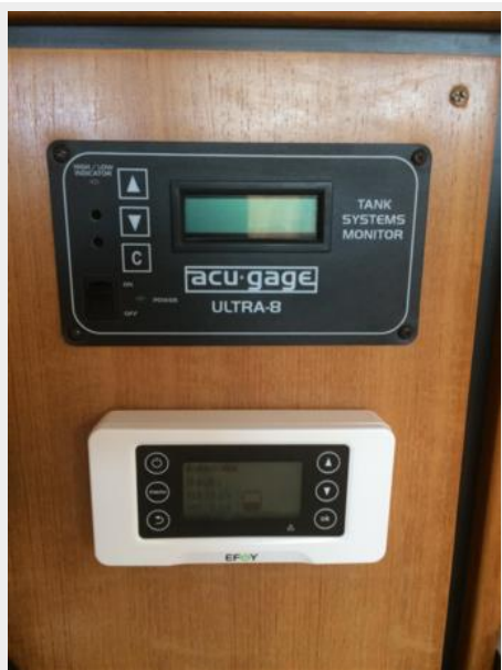
Tank Gauge and Efoy Control Panel