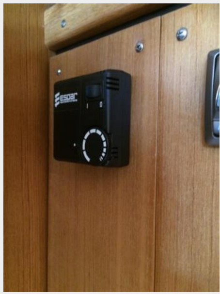
Espar Hydronic Diesel Heat