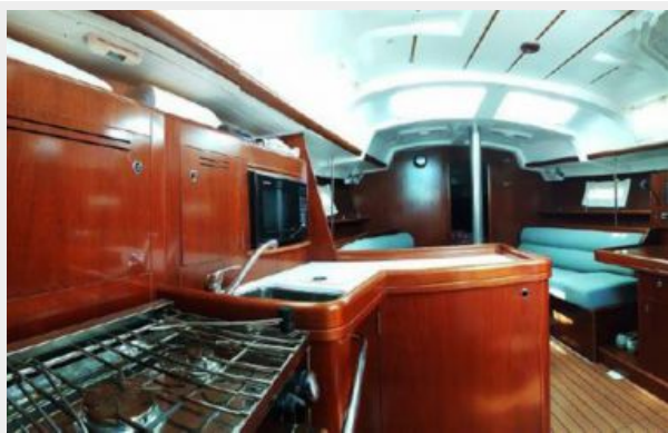
Looking Fwd From Aft Cabin