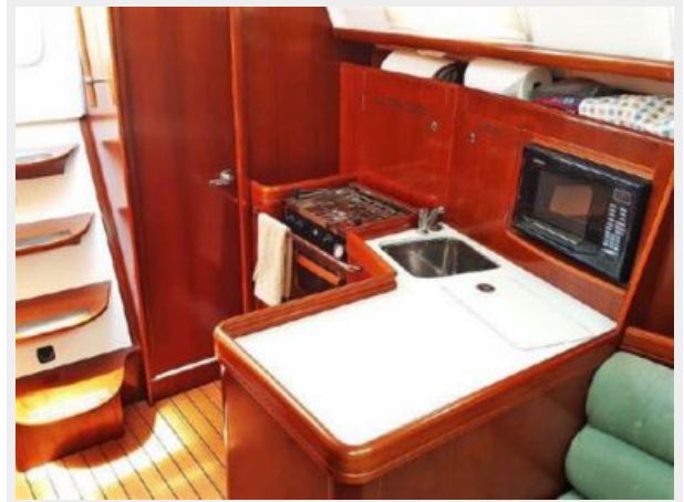
Galley from Salon