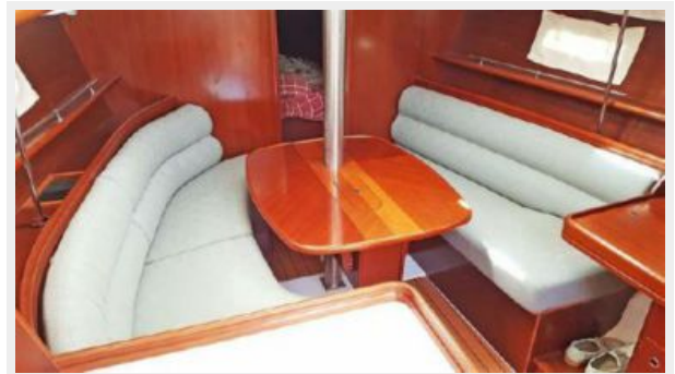
Salon Table Up