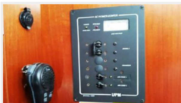
120 V. Panel