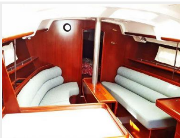
Salon Table Down