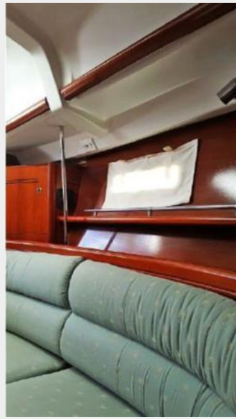
Salon Wood Work