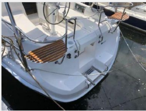
Stern Rail Seats & Swim Platform