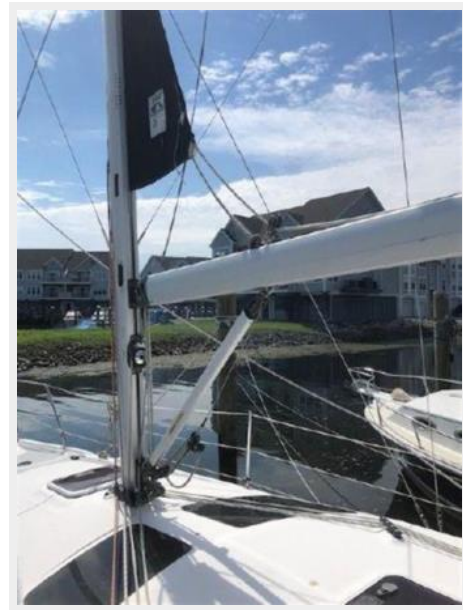
Selden Furling Mainsail