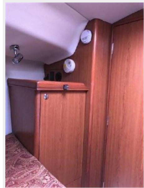
Vee Berth Hanging Locker