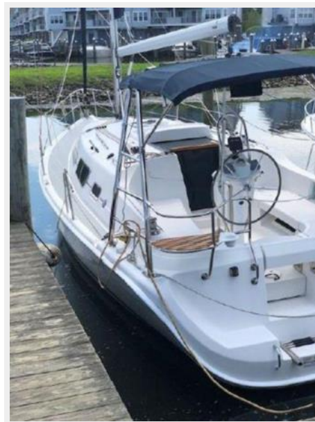
Port Side Aft Quarter