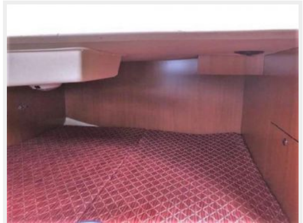
Large Athwartship Aft Berth