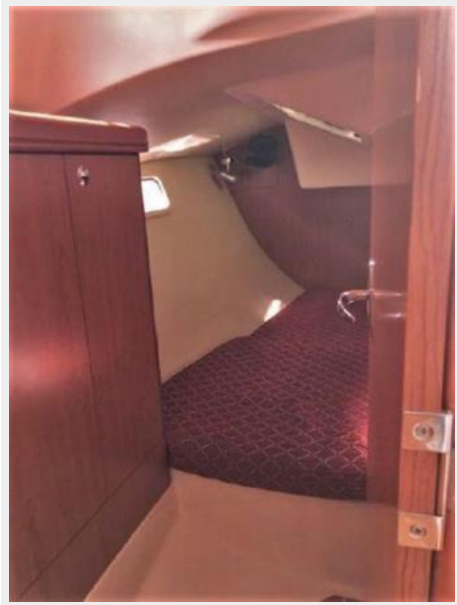
Aft Cabin Entry