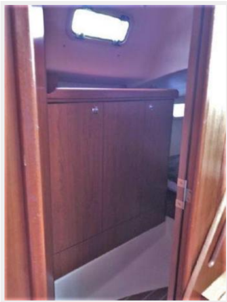
Lockers at Aft Cabin Entry