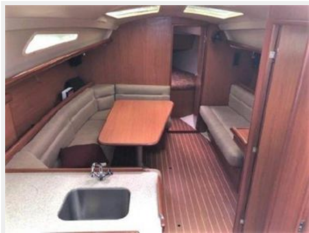
Looking Forward from Galley