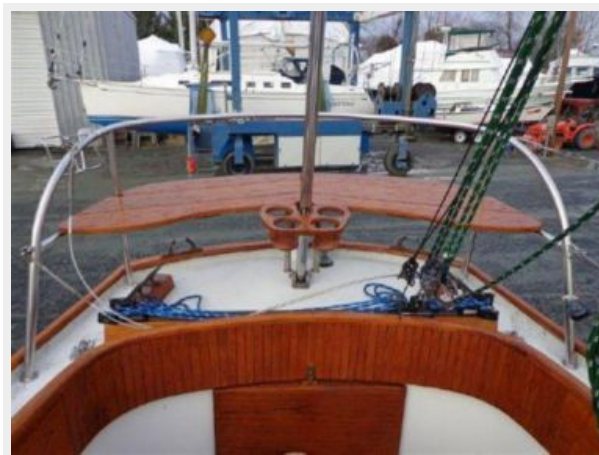
Custom Sternrail Seat with Drink Holders