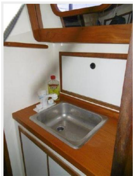
Sink in Head