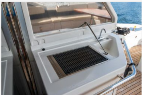
Aft Deck Grill