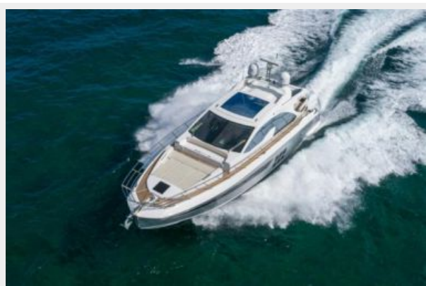
Aerial View of the Boat