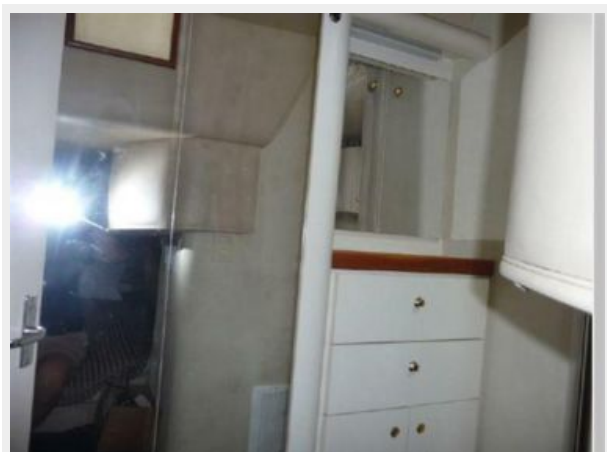
Guest closet and Vanity