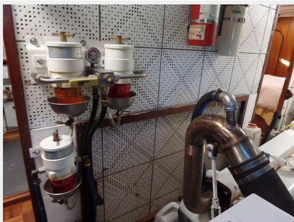
Mujuk Marine Trader 1984 Walkaround Stbd Engine Room (3)