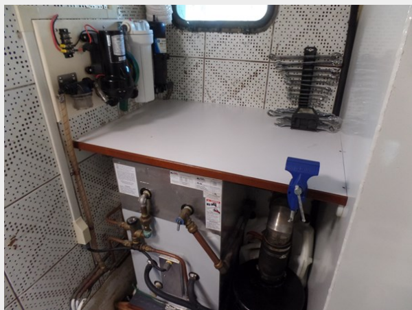
Mujuk Marine Trader 1984 Walkaround Port Engine Room Workbench