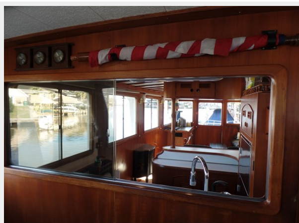
Mujuk Marine Trader 1984 Walkaround Helm facing Aft