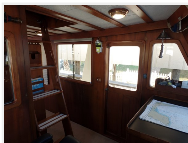
Mujuk Marine Trader 1984 Walkaround Ladder to Upper Deck