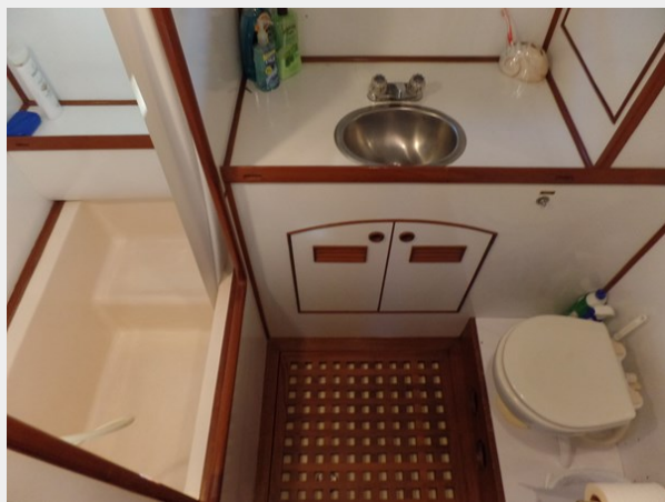
Mujuk Marine Trader 1984 Walkaround Master Head