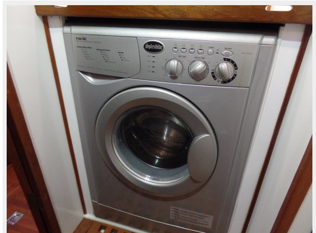
Mujuk Marine Trader 1984 Walkaround Washer and Dryer