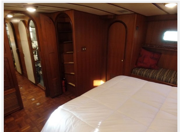
Mujuk Marine Trader 1984 Walkaround Master Stateroom (3)