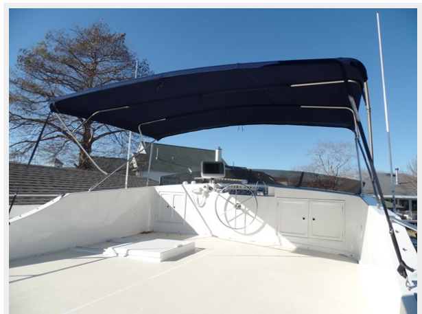
Mujuk Marine Trader 1984 Walkaround Bridge