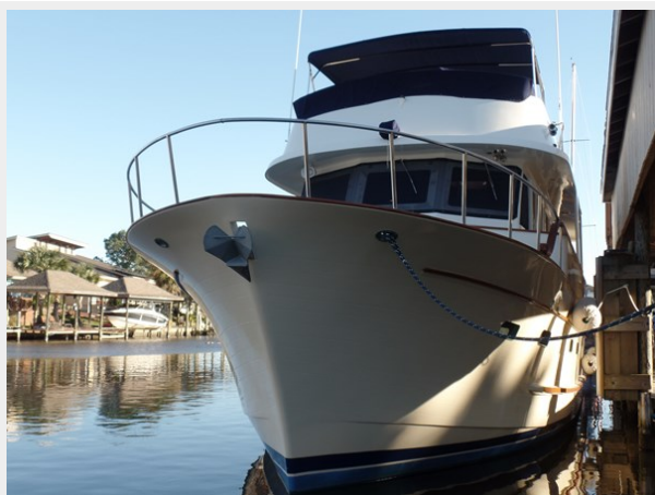
Mujuk Marine Trader 1984 Walkaround Profile Bow