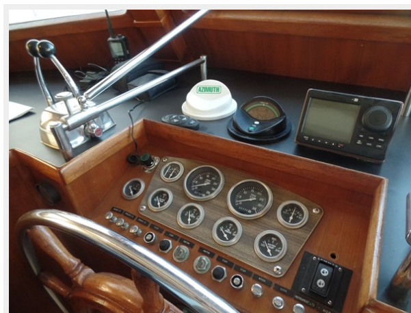
Mujuk Marine Trader 1984 Walkaround Helm