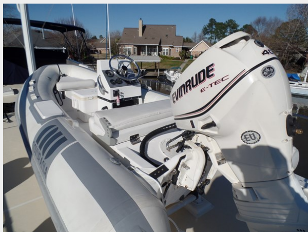
Mujuk Marine Trader 1984 Walkaround Tender (2)