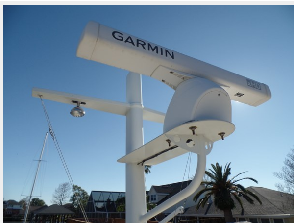
Mujuk Marine Trader 1984 Walkaround Radar Mast