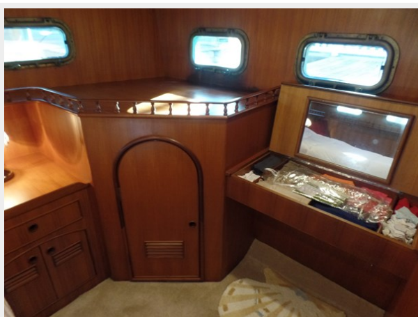
Mujuk Marine Trader 1984 Walkaround Master Stateroom (4)