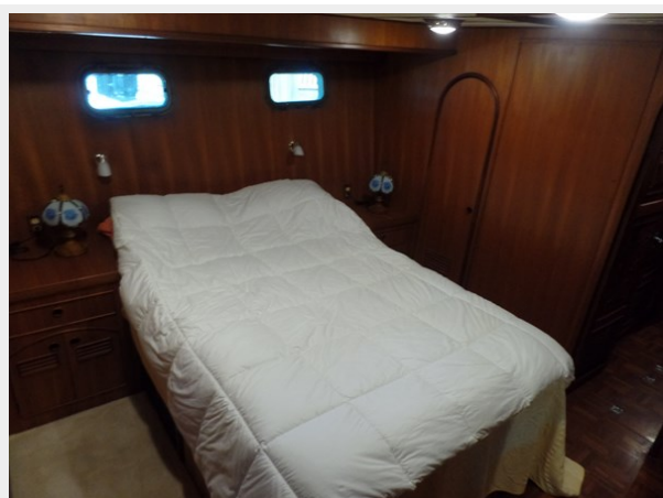
Mujuk Marine Trader 1984 Walkaround VIP Stateroom (2)