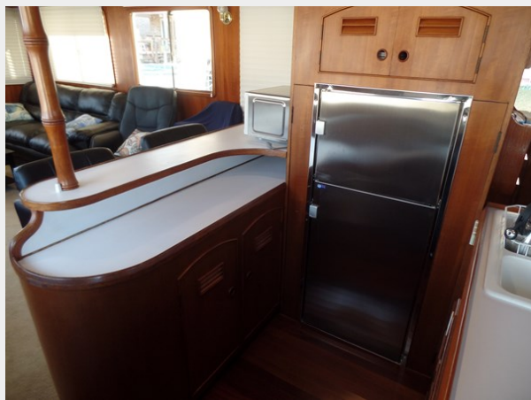
Mujuk Marine Trader 1984 Walkaround Refrigerator