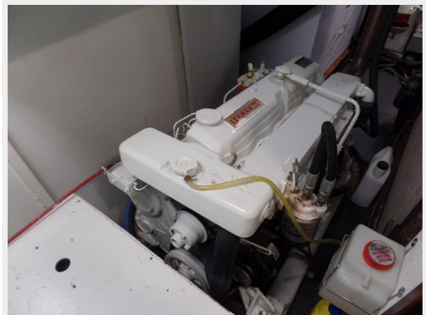
Mujuk Marine Trader 1984 Walkaround Stbd Engine