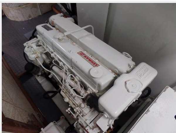
Mujuk Marine Trader 1984 Walkaround Port Engine