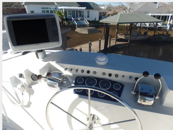
Mujuk Marine Trader 1984 Walkaround Upper Helm Station