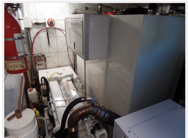
Mujuk Marine Trader 1984 Walkaround Stbd Engine Room (2)