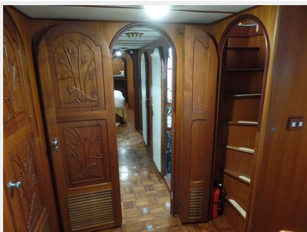
Mujuk Marine Trader 1984 Walkaround Passageway to VIP Stateroom