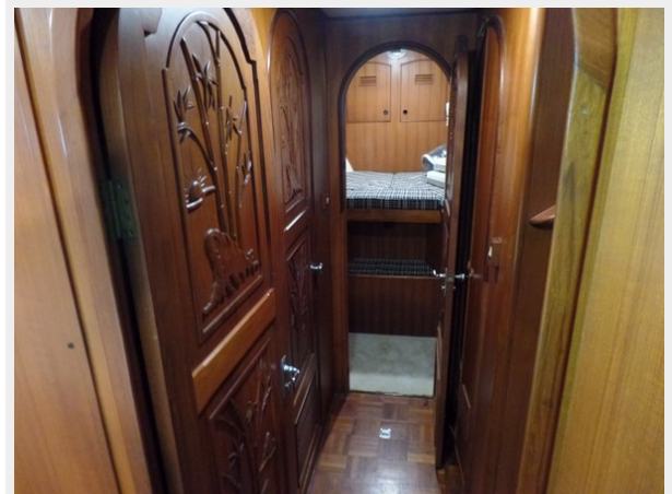
Mujuk Marine Trader 1984 Walkaround Passageway to Forward Stateroom