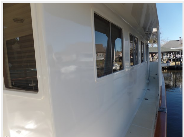
Mujuk Marine Trader 1984 Walkaround Stbd side of House