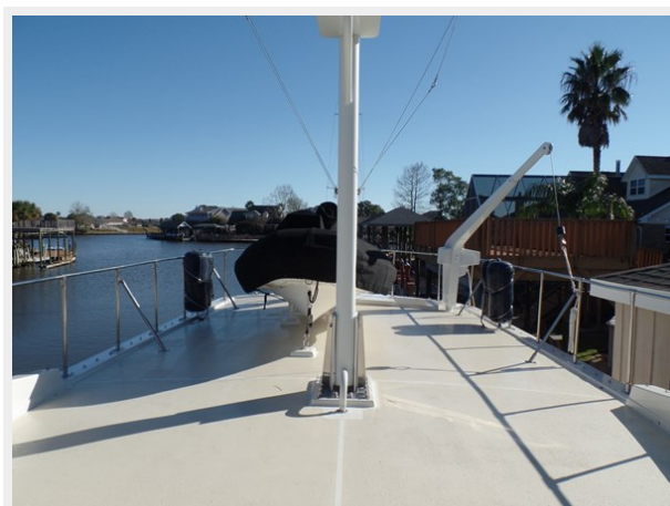
Mujuk Marine Trader 1984 Walkaround Upper Deck 2