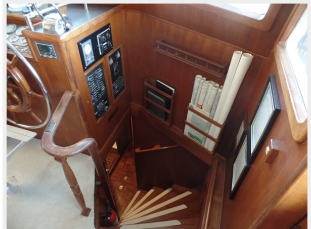
Mujuk Marine Trader 1984 Walkaround Ladder below Deck