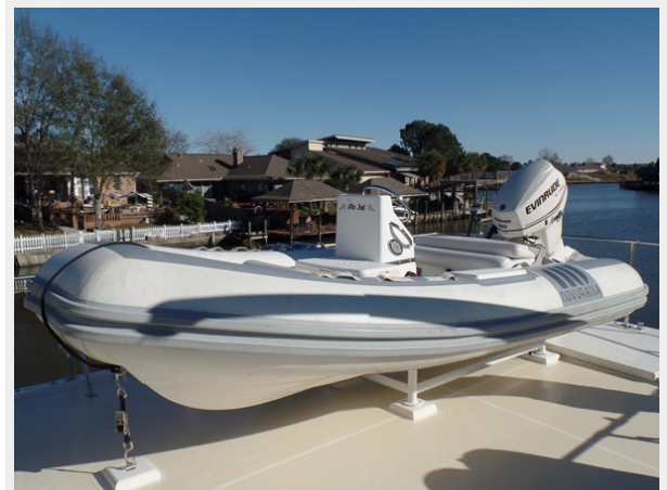
Mujuk Marine Trader 1984 Walkaround Tender