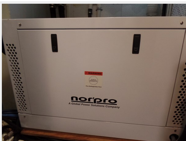
Mujuk Marine Trader 1984 Walkaround Genset