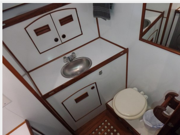
Mujuk Marine Trader 1984 Walkaround Forward Vanity