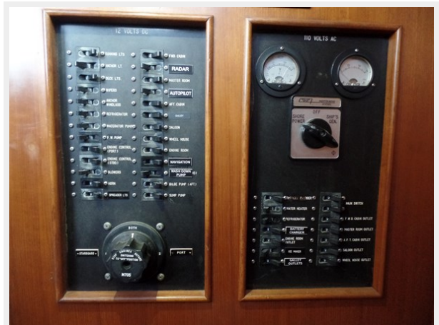
Mujuk Marine Trader 1984 Walkaround Distribution Panel