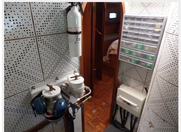
Mujuk Marine Trader 1984 Walkaround Port Engine Room