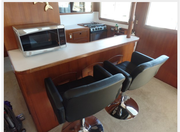
Mujuk Marine Trader 1984 Walkaround Bar Stools