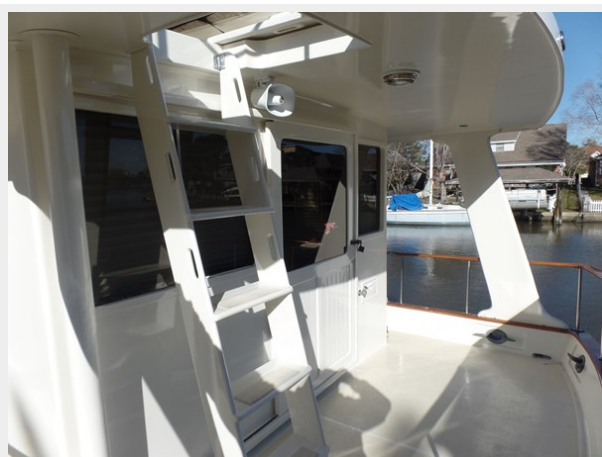
Mujuk Marine Trader 1984 Walkaround Aft Deck