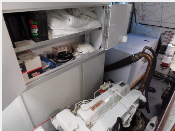
Mujuk Marine Trader 1984 Walkaround Stbd Engine Room