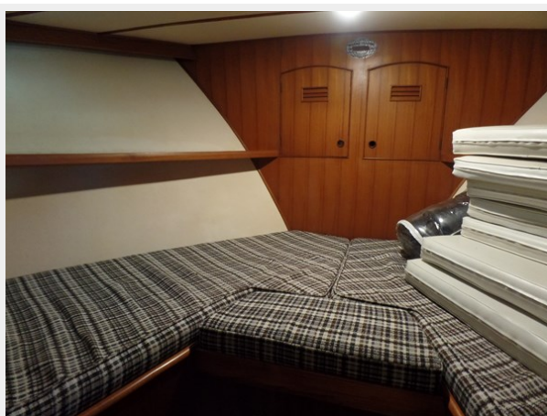
Mujuk Marine Trader 1984 Walkaround Fwd Stateroom