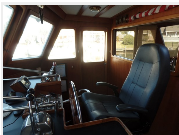
Mujuk Marine Trader 1984 Walkaround Helm Seat