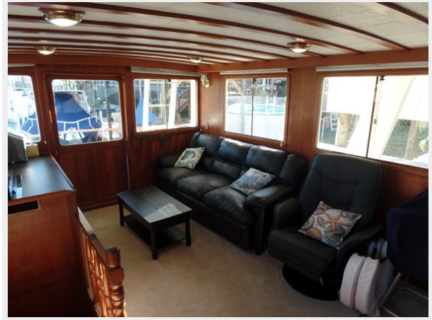
Мужук Marine Trader 1984 Walkaround Salon