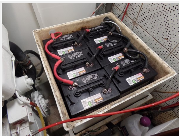
Mujuk Marine Trader 1984 Walkaround Batteries