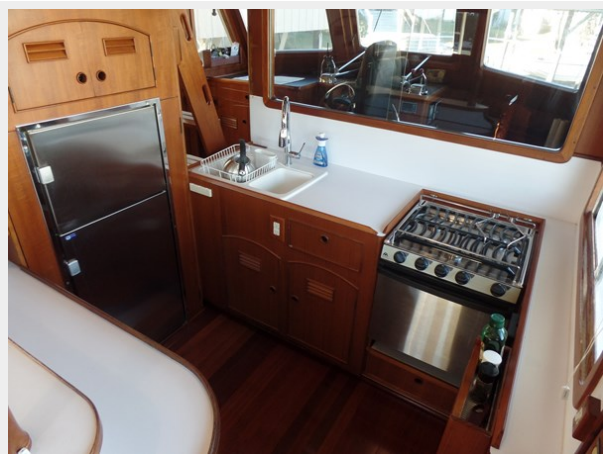
Мужук Marine Trader 1984 Walkaround Galley (2)