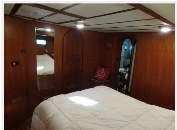
Mujuk Marine Trader 1984 Walkaround VIP Stateroom