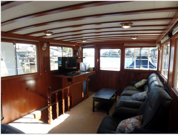
Мужук Marine Trader 1984 Walkaround Salon (2)