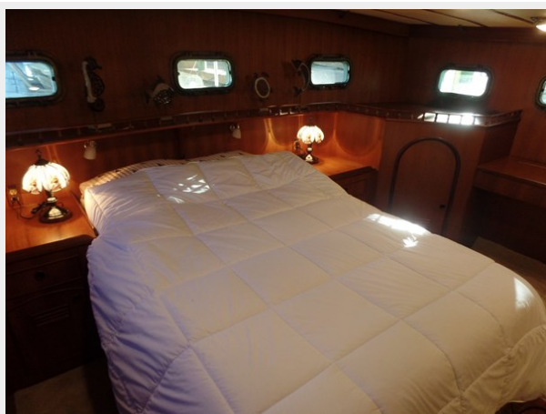
Mujuk Marine Trader 1984 Walkaround Master Stateroom (2)