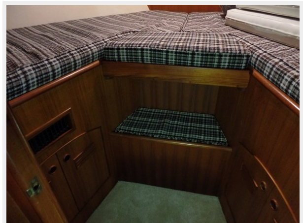
Mujuk Marine Trader 1984 Walkaround Fwd Stateroom (2)