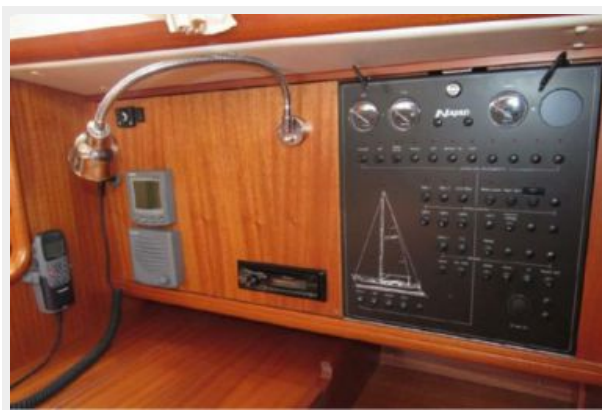
Electrical panel and electronics at nav station