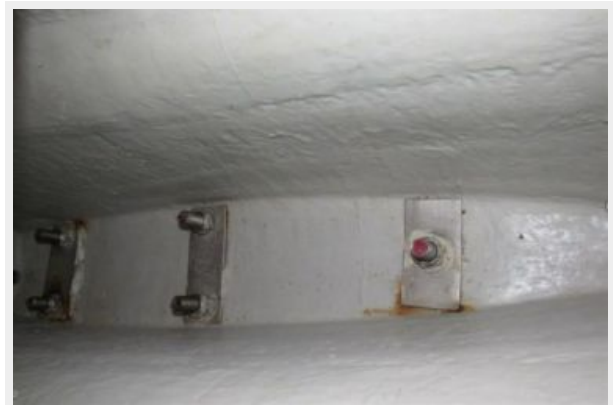
Bilge and keel bolts