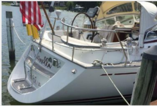
Transom from the dock