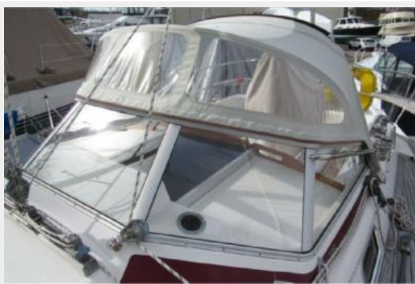
Rigid windscreen and dodger