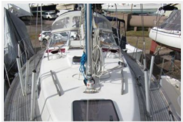
Deck looking aft