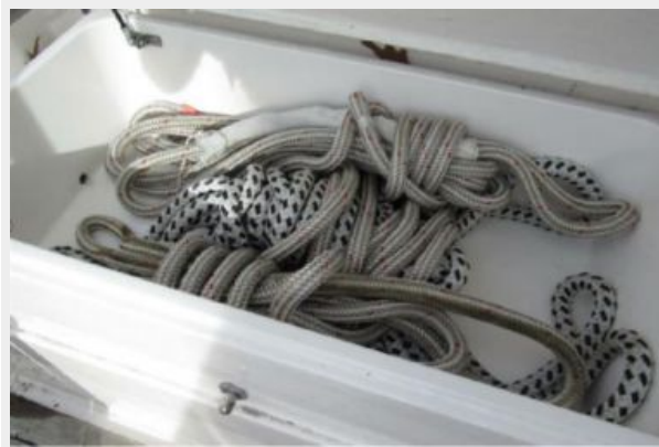
Cockpit rope storage