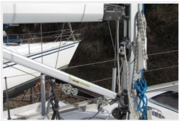
Mast and rigid vang