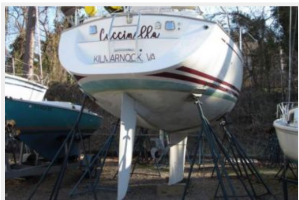
Cuccinella on the hard