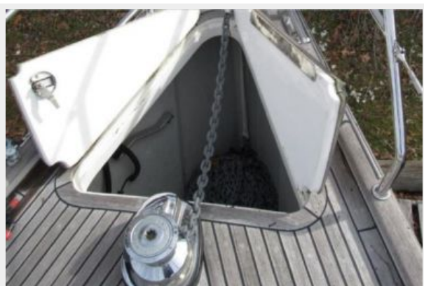
Windlass and anchor locker