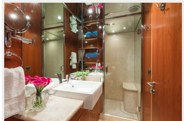
Lower Deck Guest Head