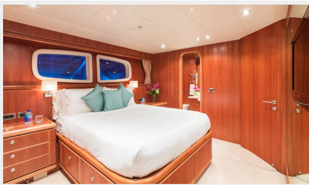
Lower Deck Guest Stateroom