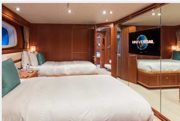
Lower Deck Guest Stateroom