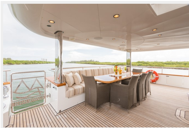
Aft Deck Dining Area