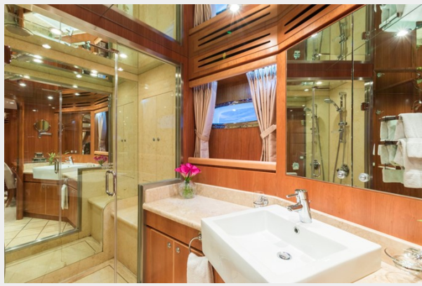
Lower Deck VIP Head