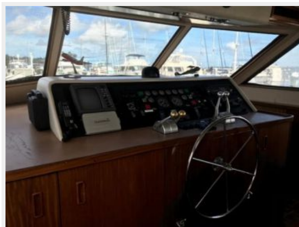
Lower helm 1