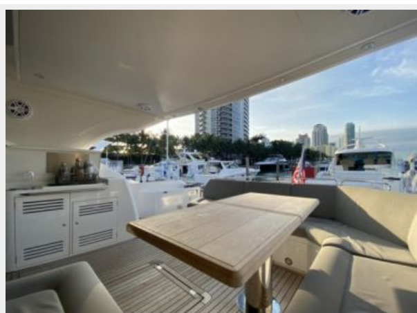
Aft Deck Table