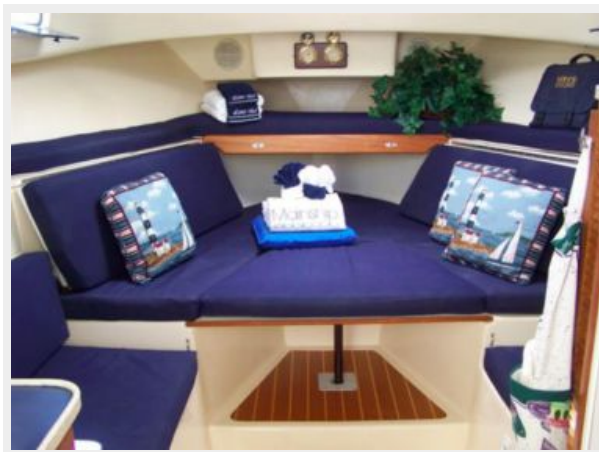
10-1998 Mainship Pilot 30 _Luna Sol_