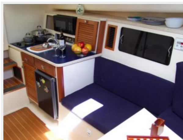
8-1998 Mainship Pilot 30 _Luna Sol_