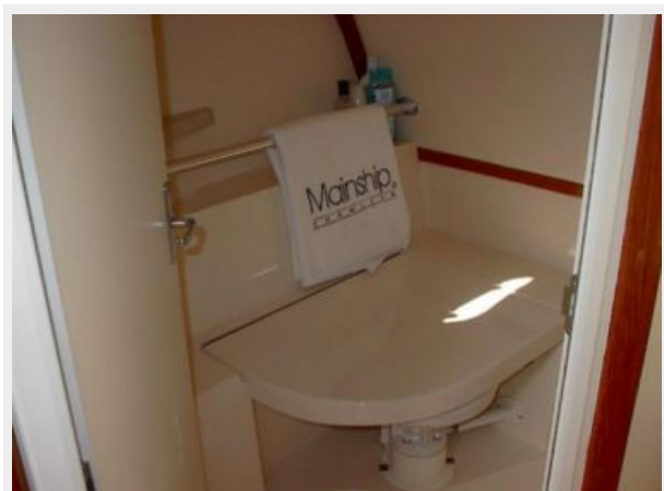
11-1998 Mainship Pilot 30 _Luna Sol_