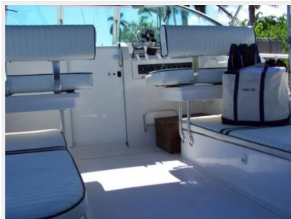
4-1998 Mainship Pilot 30 _Luna Sol_