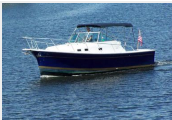
3-1998 Mainship Pilot 30 _Luna Sol_