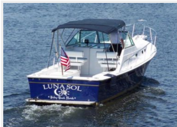
2-1998 Mainship Pilot 30 _Luna Sol_