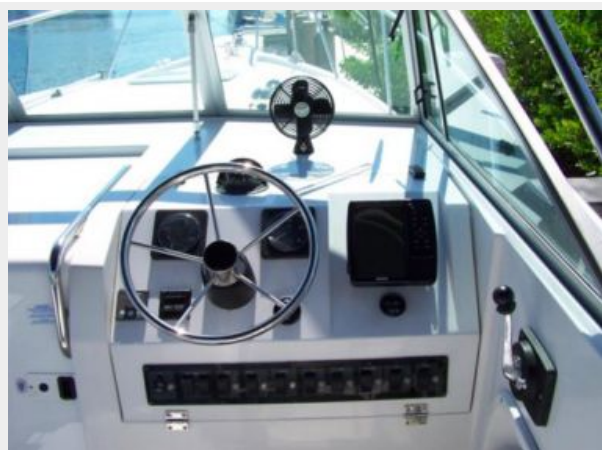
5-1998 Mainship Pilot 30 _Luna Sol_