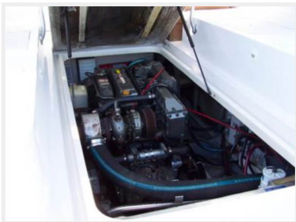
7-1998 Mainship Pilot 30 _Luna Sol_