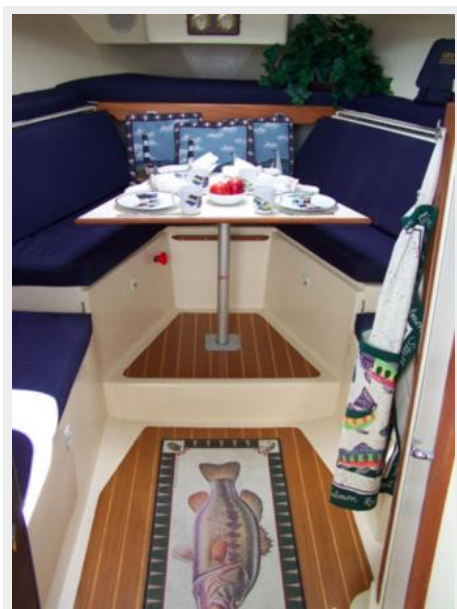
9-1998 Mainship Pilot 30 _Luna Sol_