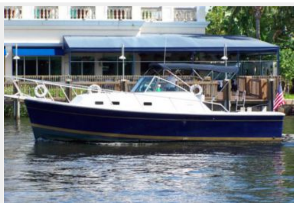
1 -1998 Mainship Pilot 30 _Luna Sol_