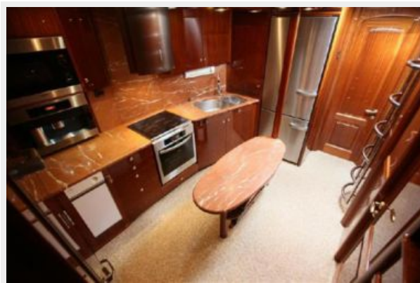
Motor sailing yacht kitchen