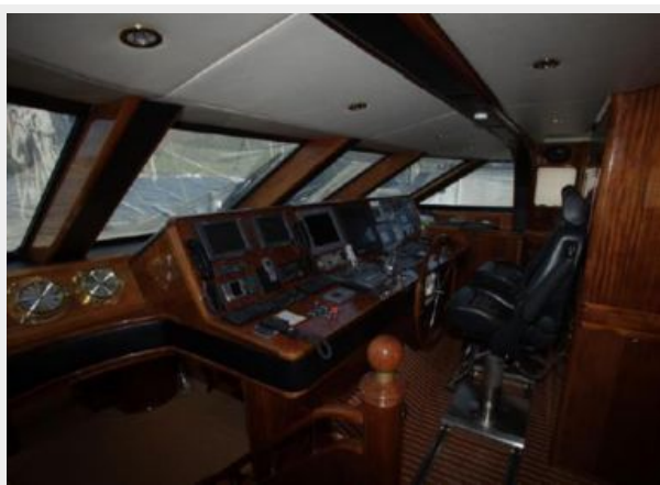
Motor sailing yacht Ocean Star helm position