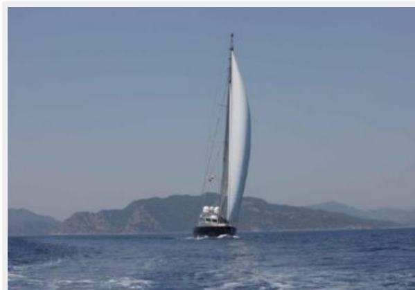
Motor sailing yacht Ocean Star