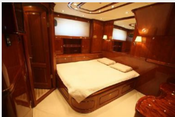
Motor sailing yacht VIP guest cabin