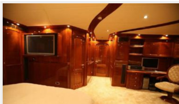
Motor sailing yacht master bedroom