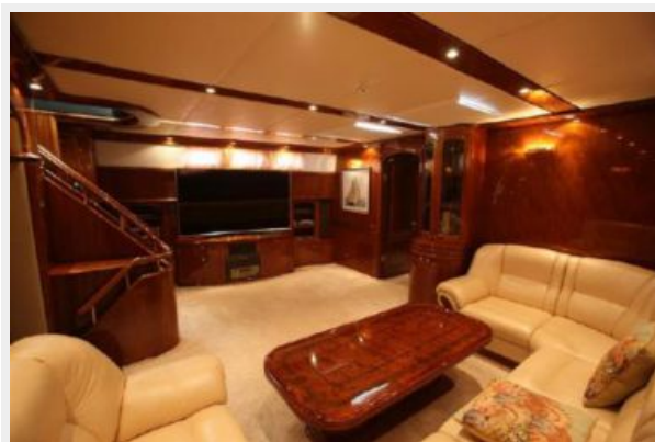
Motor sailing yacht living room