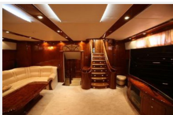
Motor sailing yacht staircase