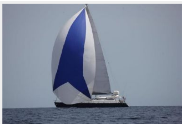
Motor sailing yacht Ocean Star