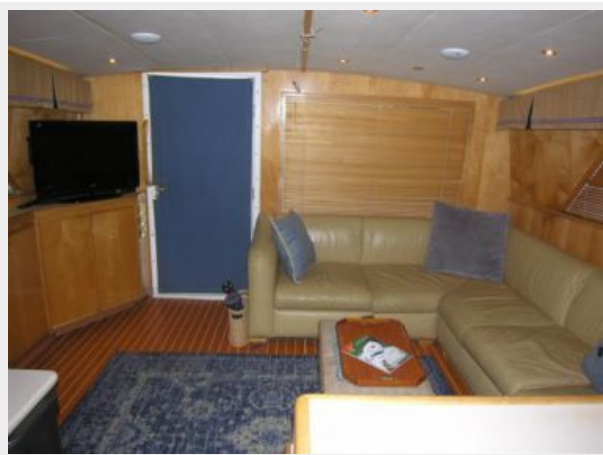
Salon Looking Aft