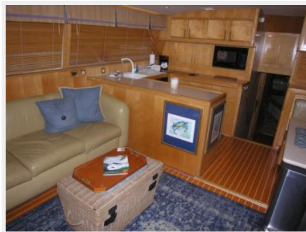
Salon / Galley