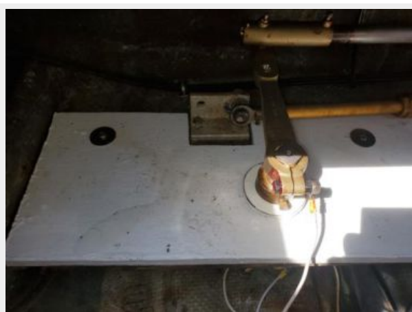
New rudder bearing and support table (starboard)