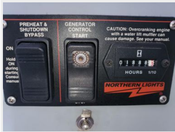
Generator hour meter