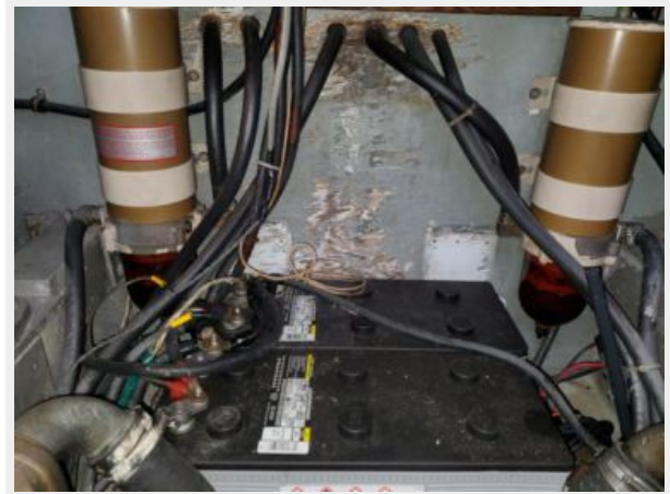
Batteries and Racors