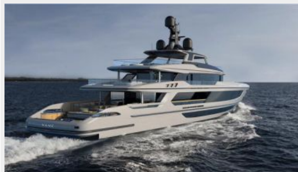
BAGLIETTO T52_52MT_HYBRID_MOTORYACHT 2