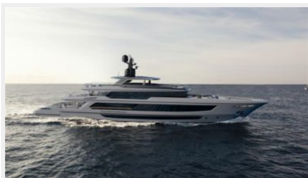
BAGLIETTO T52_52MT_HYBRID_MOTORYACHT 3