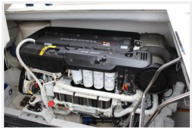
VanDutch55_2015_White Shark_Engine 1