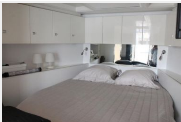
VanDutch55_2015_White Shark_Master Cabin