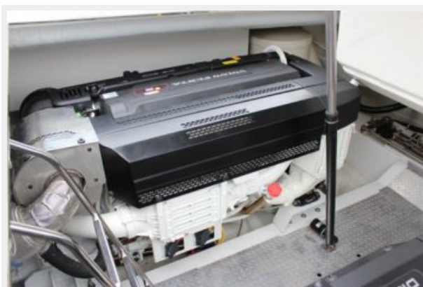
VanDutch55_2015_White Shark_Engine 2