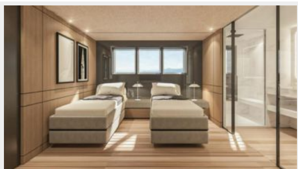
CONRAD C144S (14)