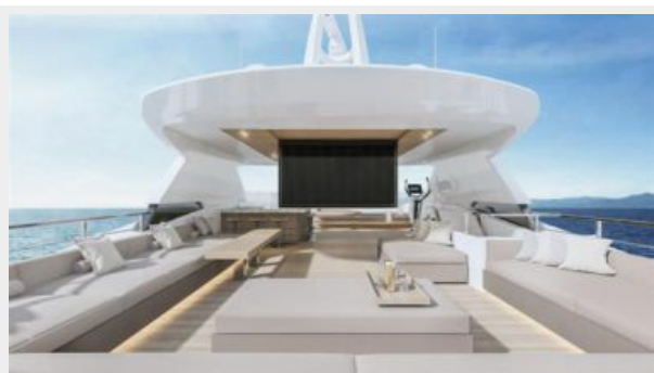
CONRAD C144S (6)