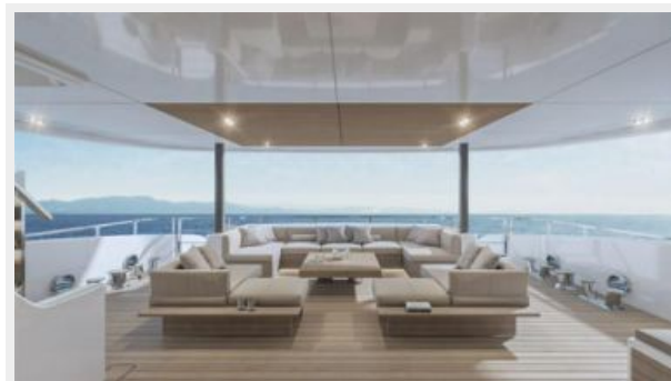
CONRAD C144S (2)