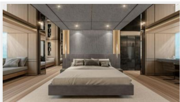
CONRAD C144S (24)