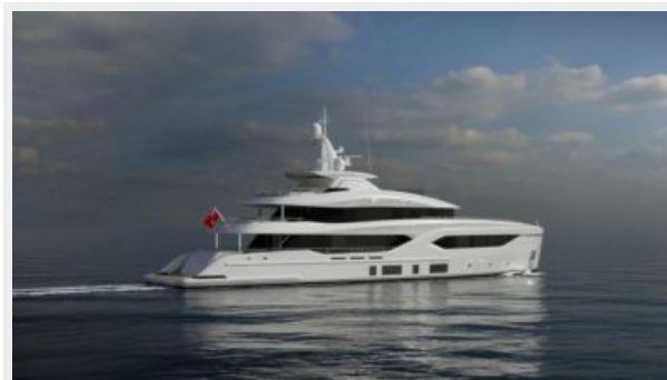
CONRAD C144S 1 (4)