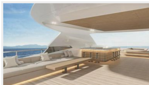
CONRAD C144S (8)