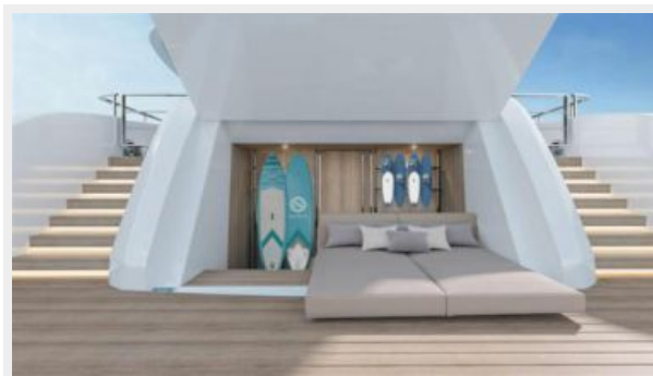
CONRAD C144S 2 (2)