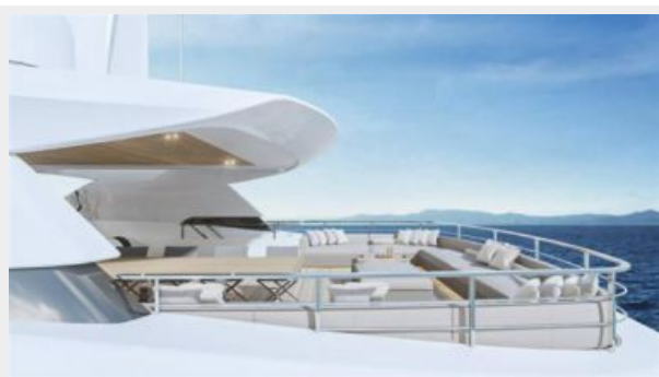
CONRAD C144S (10)