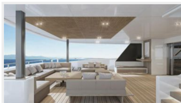
CONRAD C144S (4)