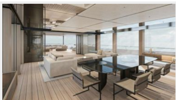
CONRAD C144S (21)