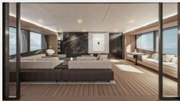
CONRAD C144S (33)