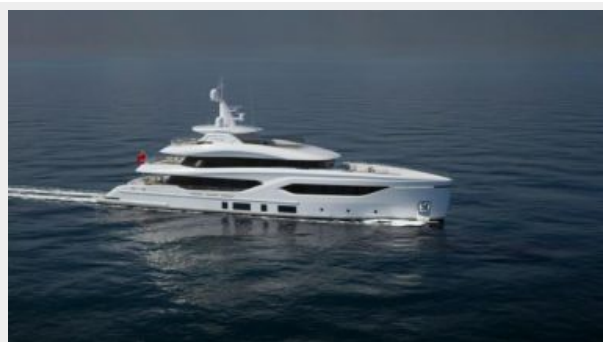
CONRAD C144S 1 (2)