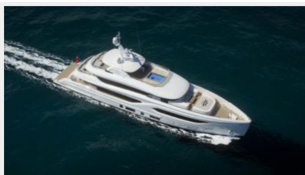
CONRAD C144S 1 (6)