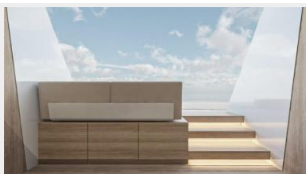
CONRAD C144S 2 (3)