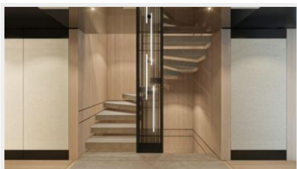
CONRAD C144S (19)