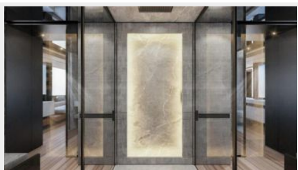
CONRAD C144S (27)