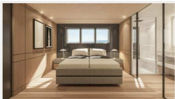
CONRAD C144S (15)