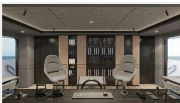
CONRAD C144S (41)