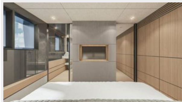
CONRAD C144S (36)