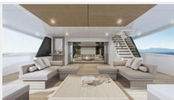
CONRAD C144S (3)