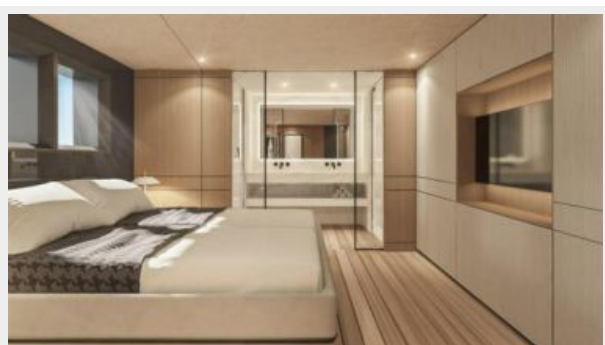
CONRAD C144S (17)