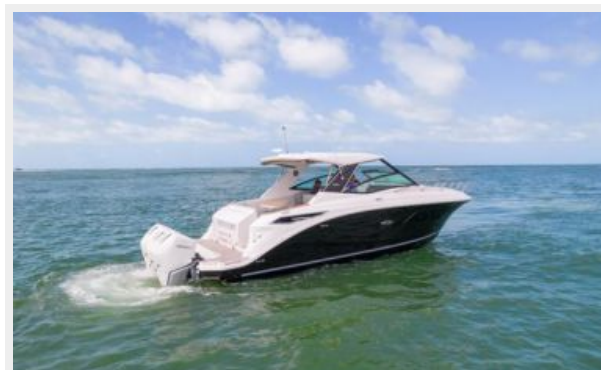
Stbd quarter profile