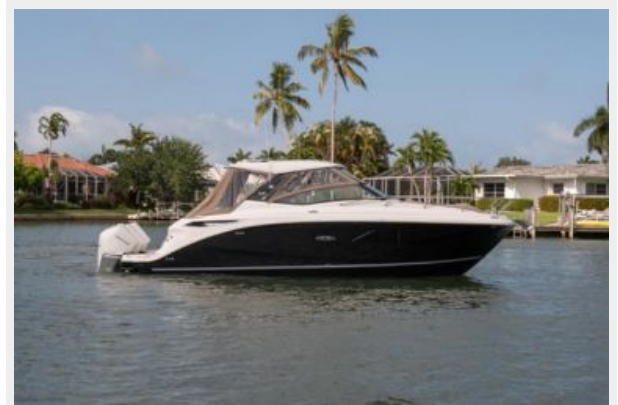
Stbd profile 2