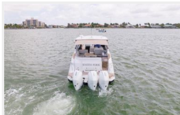
Stern profile 2