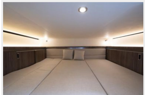
Mid-berth view 2