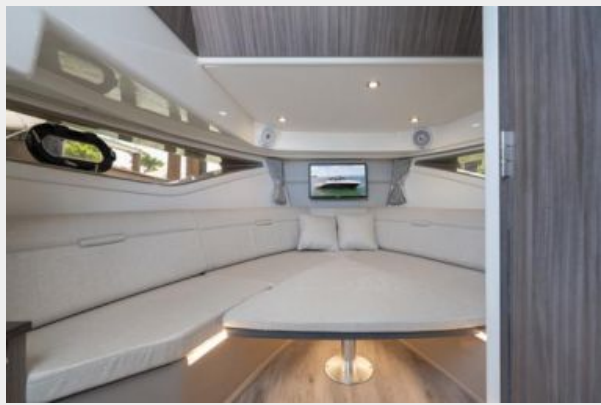
Salon view 2