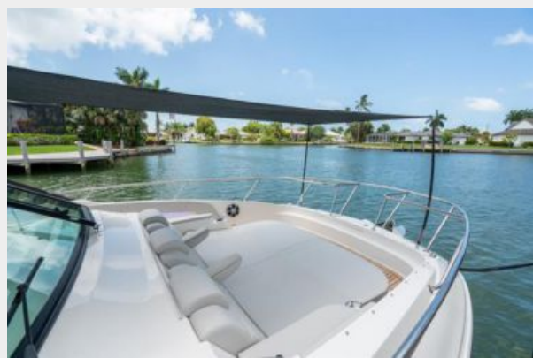
Bow seating with sunshade