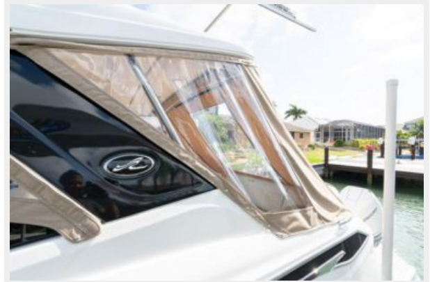
Cockpit enclosure view 2