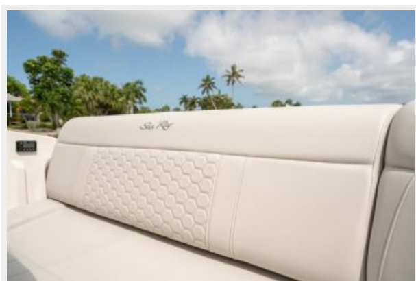
Aft bench seat