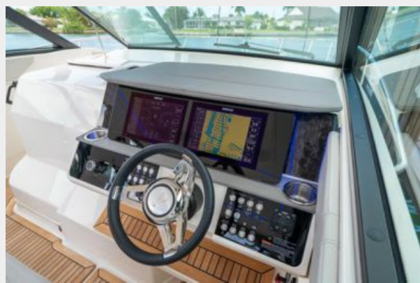
Helm dashboard view 2