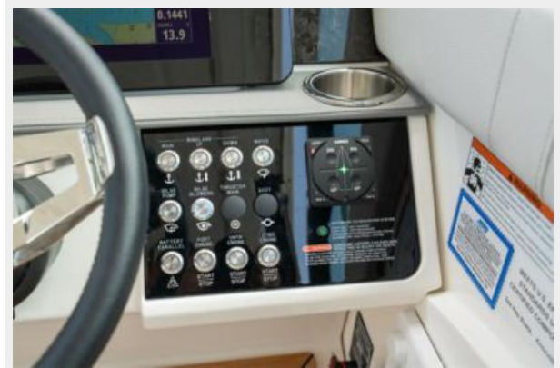
Helm controls/switch panel