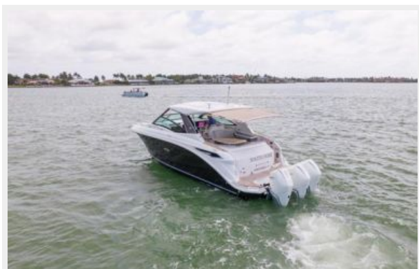
Port quarter profile 2