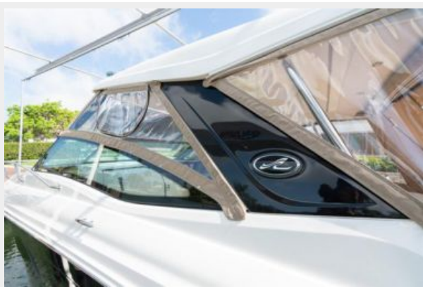
Cockpit and helm enclosures