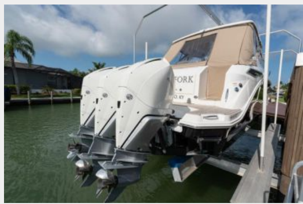
Triple engines view 2