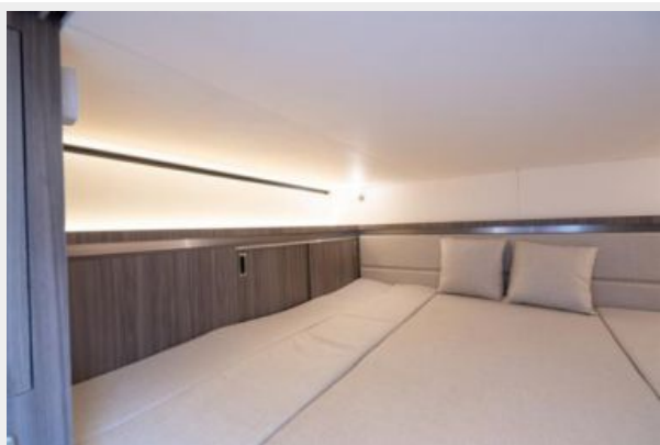
Storage in the mid-berth