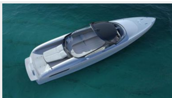
WhatsApp Image 2021-05-10 at 11.11.43