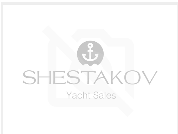
Nav station, Looking Outboard