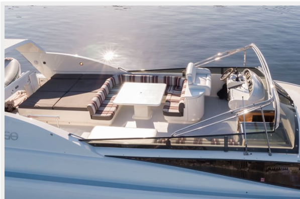
WW Air 04L