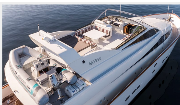
WW Air 05L