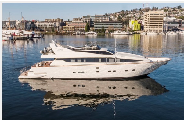
WW Air 09L