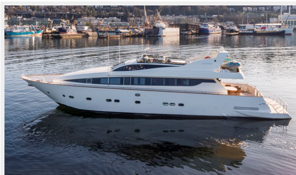
WW Air 17L