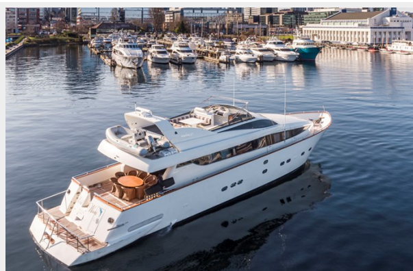
WW Air 03L