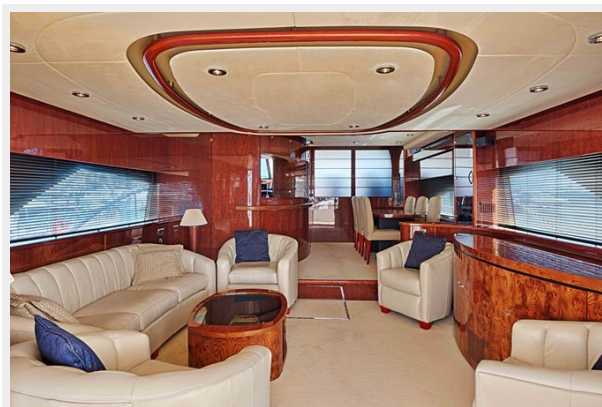
Main Salon 3