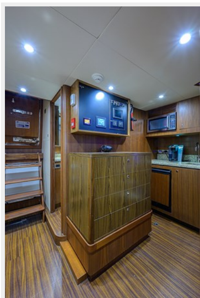
Wiggle Room_Crew Quarters2