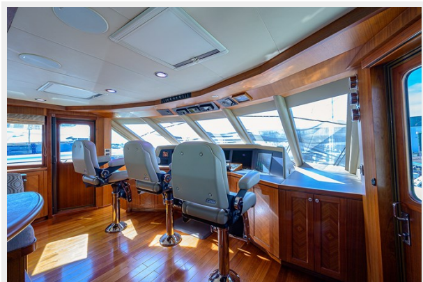
Wiggle Room_Enclosed Flybridge6