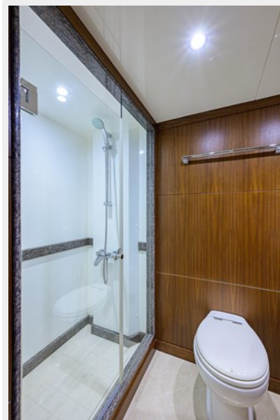
Wiggle Room_Guest Head2