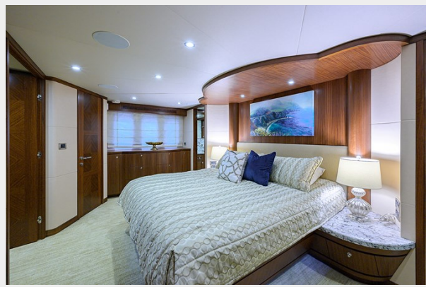
Wiggle Room_Master Stateroom3