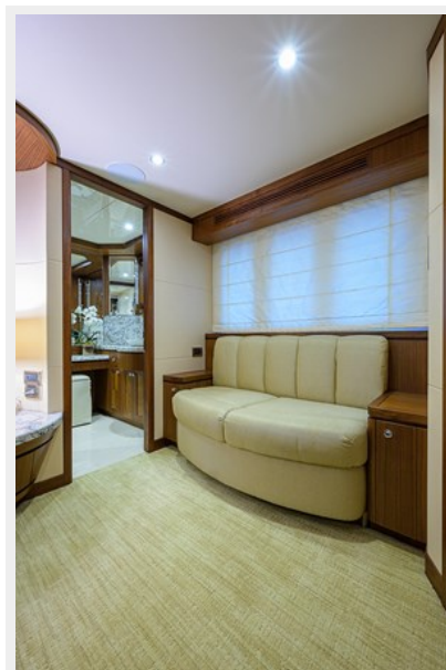
Wiggle Room_Master Stateroom8