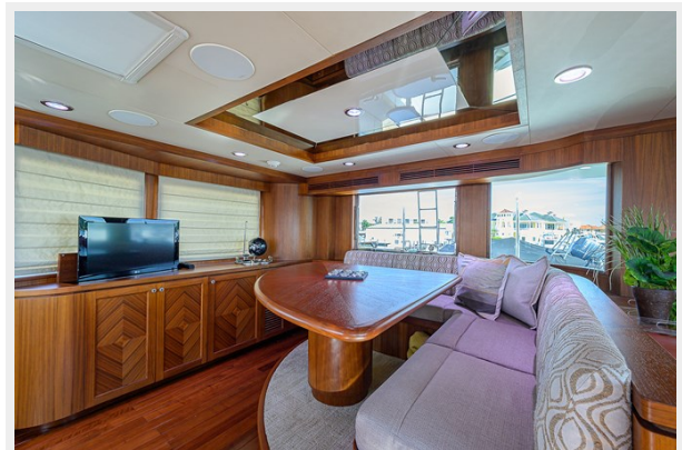
Wiggle Room_Enclosed Flybridge5