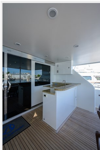
Wiggle Room_Aft Deck4