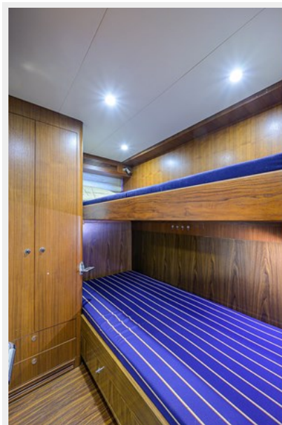
Wiggle Room_Crew Quarters7