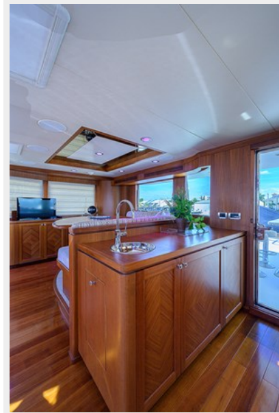
Wiggle Room_Enclosed Flybridge2