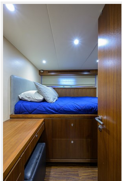
Wiggle Room_Crew Quarters4