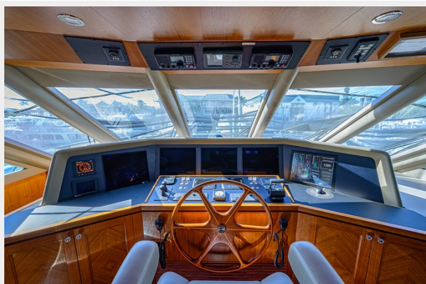
Wiggle Room_Enclosed Flybridge10