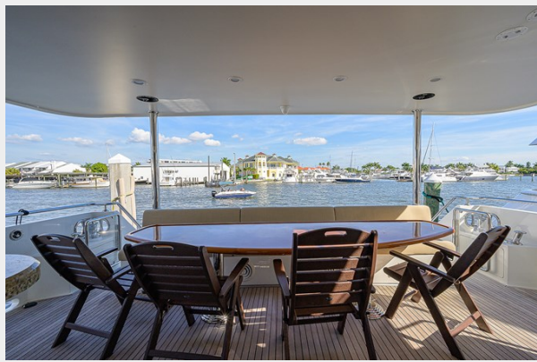
Wiggle Room_Aft Deck8