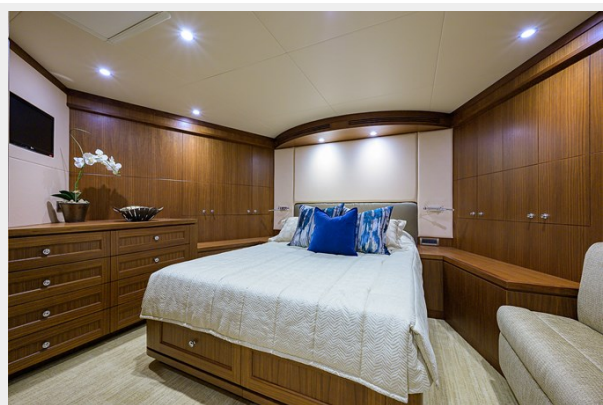
Wiggle Room_Forward Stateroom1