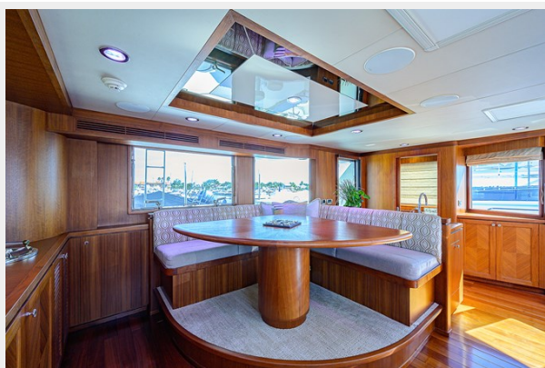
Wiggle Room_Enclosed Flybridge3