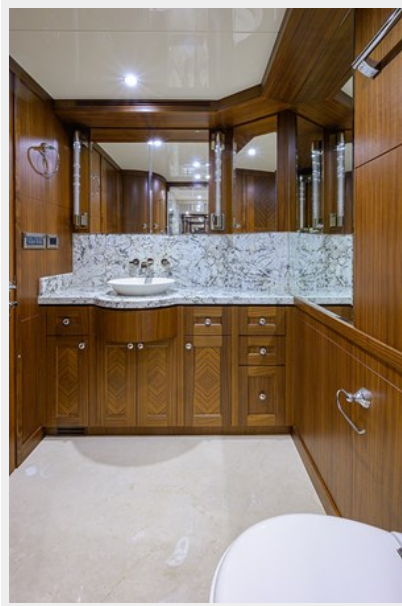
Wiggle Room_Master Head7