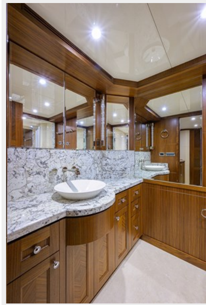
Wiggle Room_Master Head9