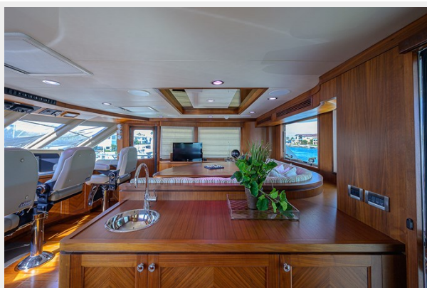
Wiggle Room_Enclosed Flybridge11