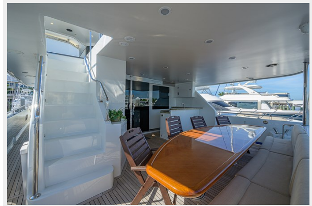
Wiggle Room_Aft Deck3