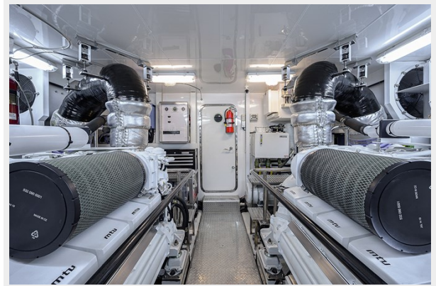
Wiggle Room_Engine Room4