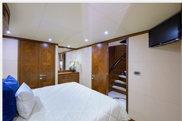
Wiggle Room_Guest Stateroom5