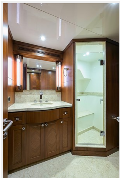
Wiggle Room_Forward Head1