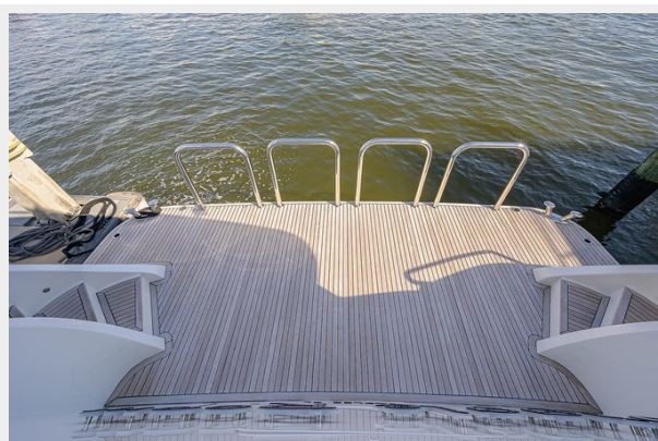
Wiggle Room_Swim Platform1