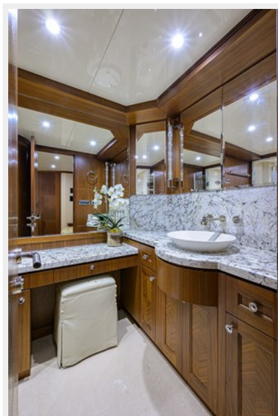
Wiggle Room_Master Head1