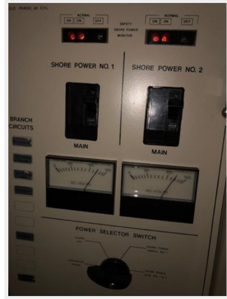
13_ELECTRIC PANEL AC READINGS