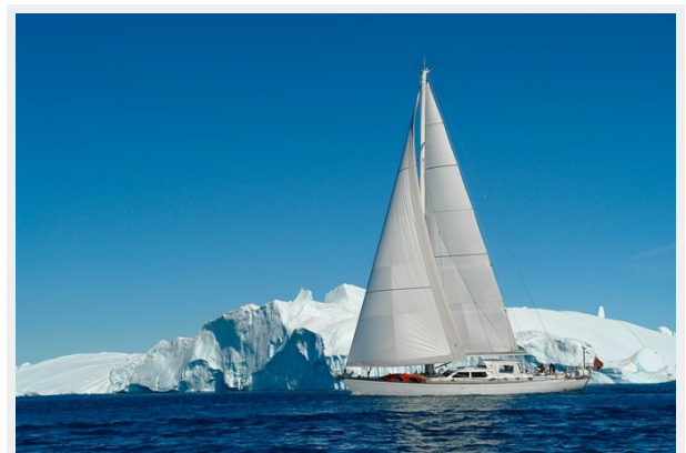
Plum at anchor