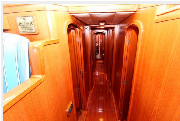
Plum yacht corridor