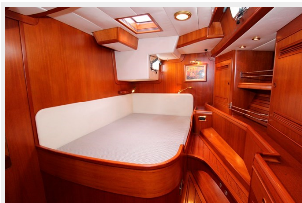
Plum yacht stateroom