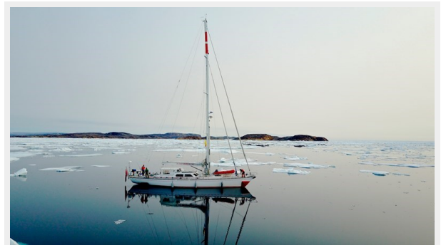
Plum sailing yacht