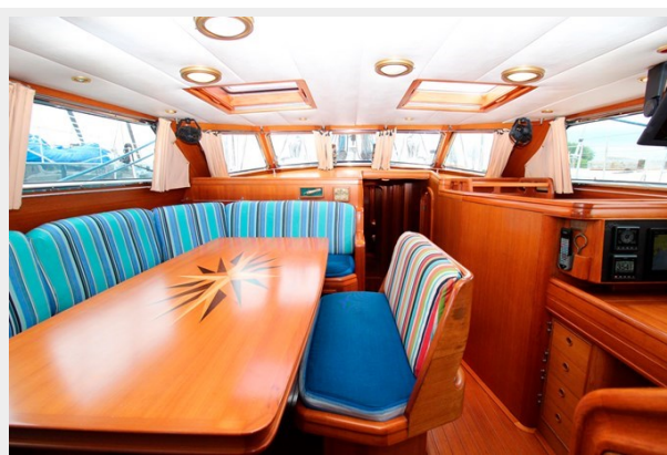
Plum yacht saloon