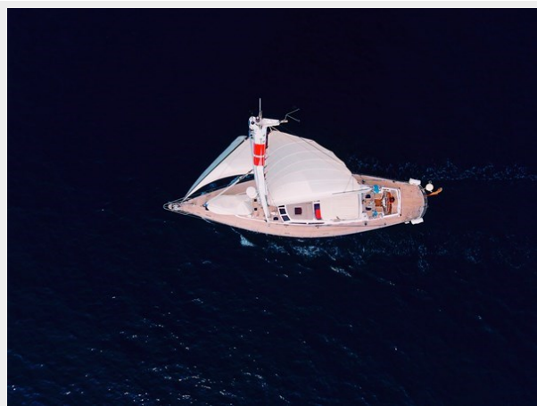
Plum yacht view