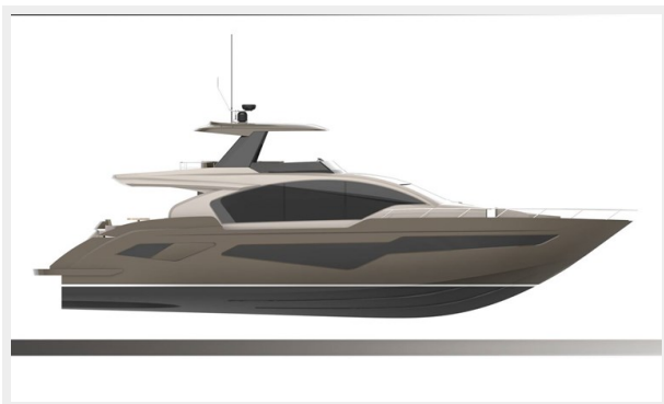
Full view SB