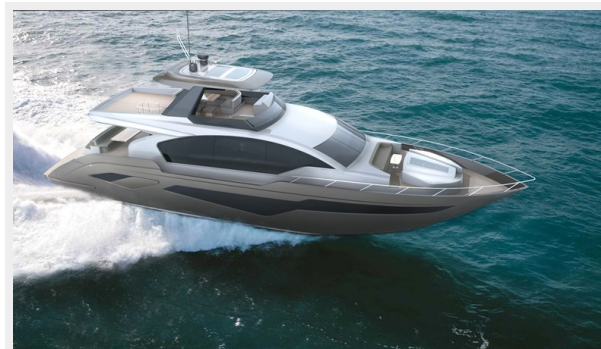
At speed bow