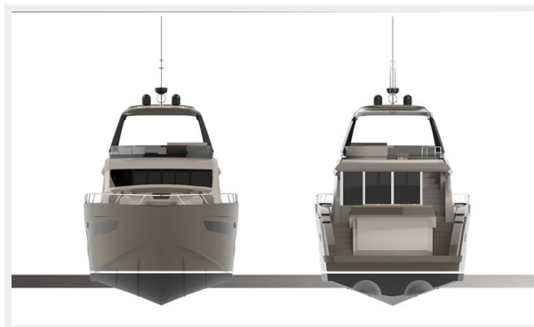
Bow & Stern view