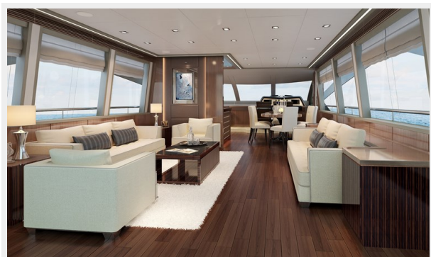
Lounge facing bow