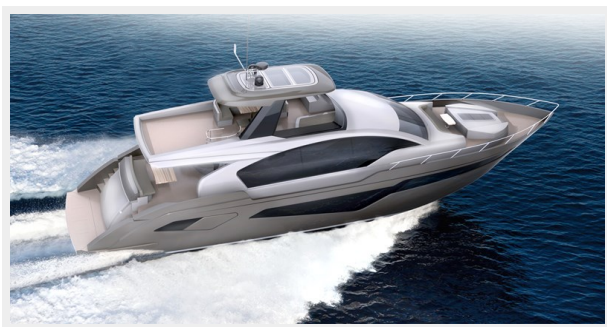
At speed stern