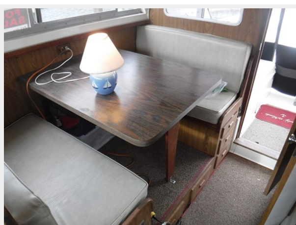
11 Salon Table