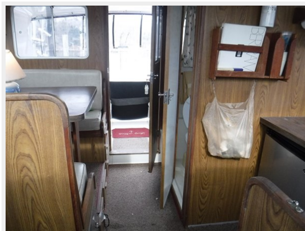
8 Salon Aft View