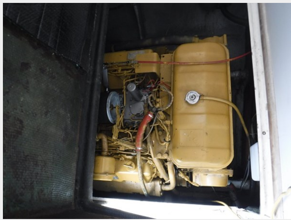
13 Cat 3208 Port