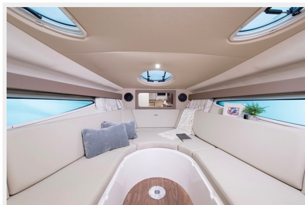
2014 REGAL 28 EXPRESS cabin bed up picture