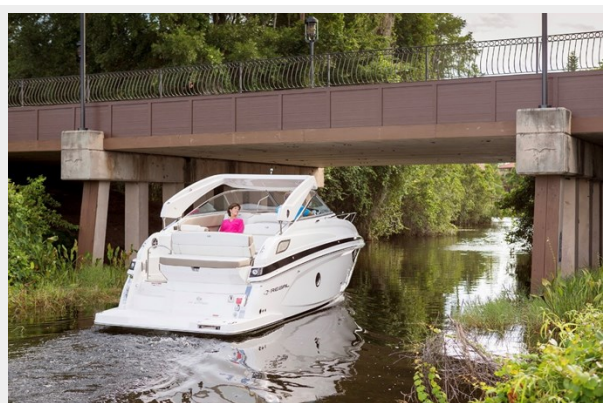
2014 REGAL 28 EXPRESS arch down picture