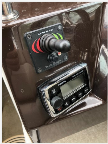
2014 REGAL 28 EXPRESS bow thruster picture