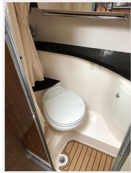
2014 REGAL 28 EXPRESS head picture