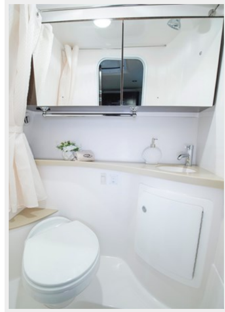
2014 REGAL 28 EXPRESS head picture