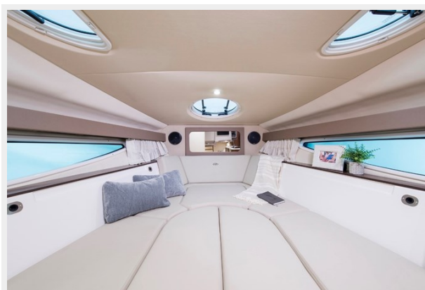
2014 REGAL 28 EXPRESS cabin bed down picture