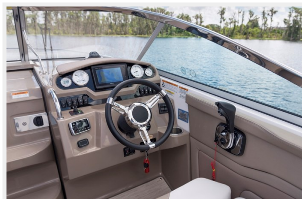
2014 REGAL 28 EXPRESS helm picture