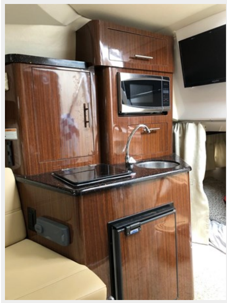
2014 REGAL 28 EXPRESS actual picture