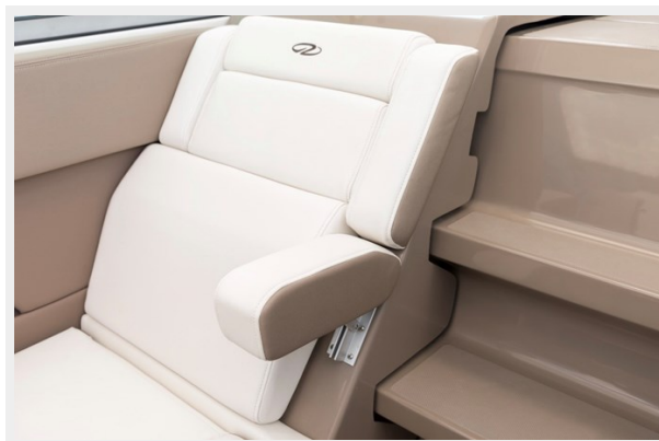
2014 REGAL 28 EXPRESS port armrest picture