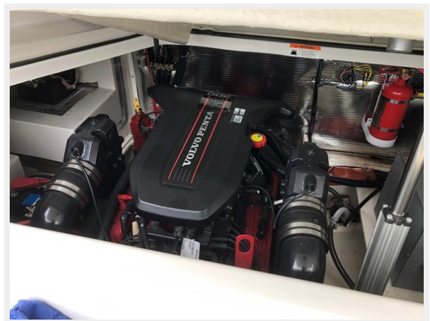
2014 REGAL 28 EXPRESS engine bay picture