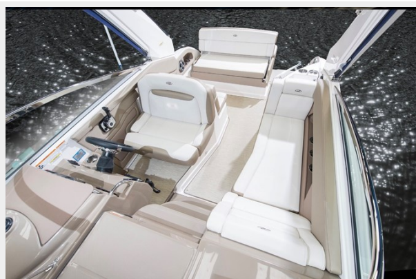
2014 REGAL 28 EXPRESS cockpit picture