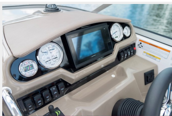
2014 REGAL 28 EXPRESS helm dash picture