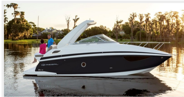
2014 REGAL 28 EXPRESS profile picture