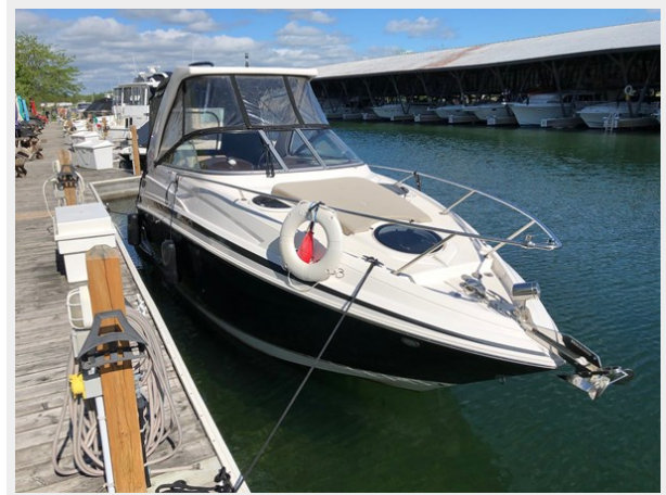
2014 REGAL 28 EXPRESS stbd bow picture