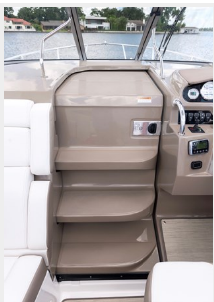
2014 REGAL 28 EXPRESS door steps picture