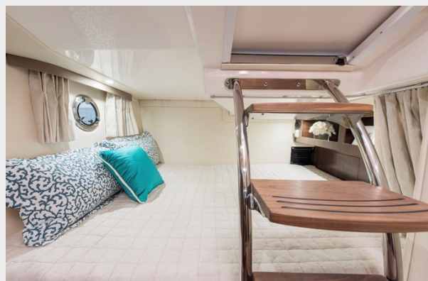
2014 REGAL 28 EXPRESS mid cabin picture