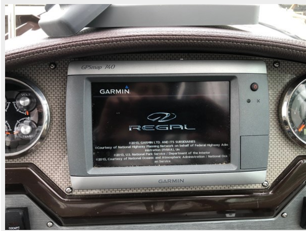
2014 REGAL 28 EXPRESS GPS picture