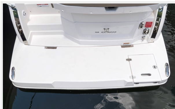
2014 REGAL 28 EXPRESS platform picture