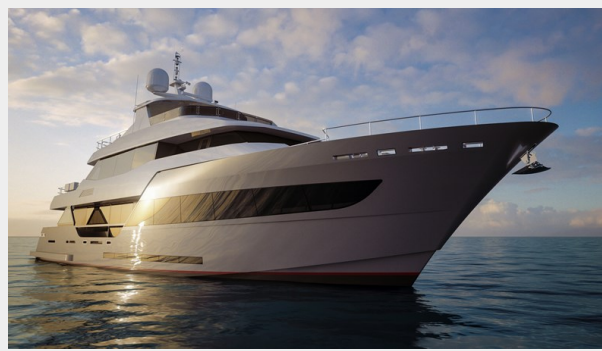
A 100 -Image 05-HR