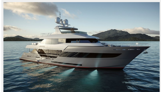
A 100 -Image 02-HR