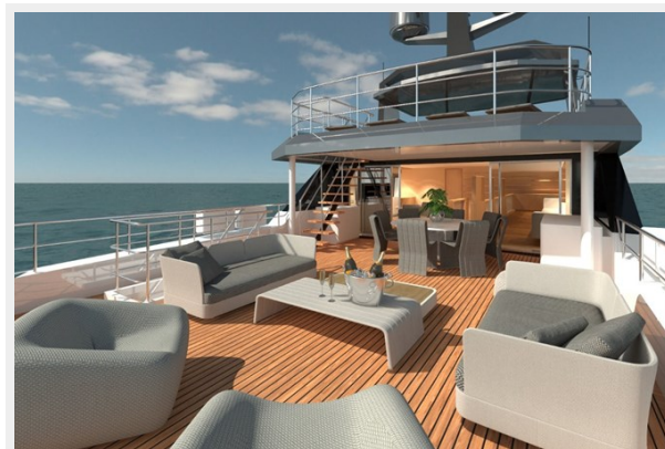
A 100 -Image 06-HR