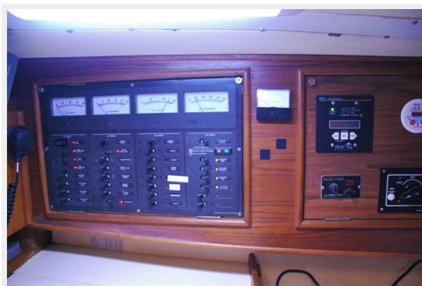
Chart table 2