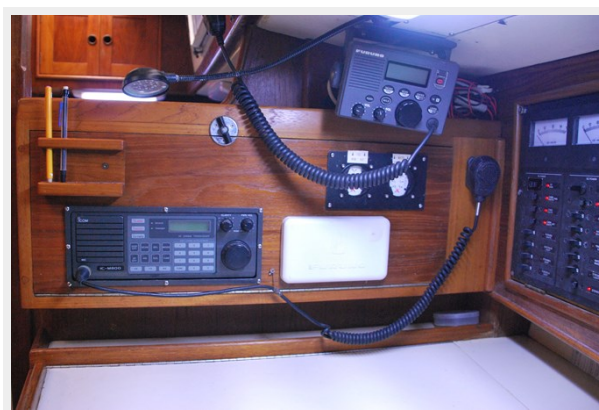
Chart table 3