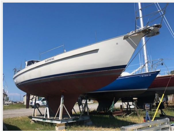
42 Niagara Starboard Bow