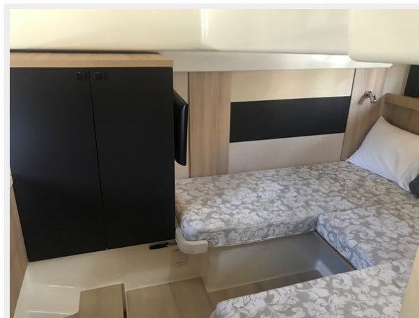
30_SBS Twin Berth WO1