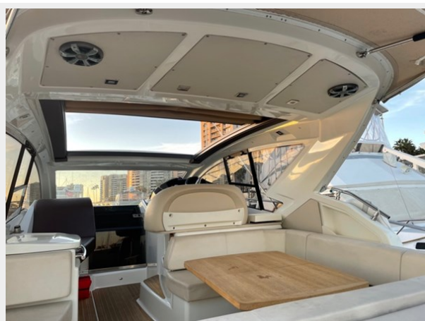
12_2015 44ft Cranchi M 44 HT BULA