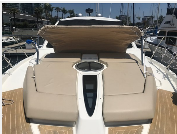
8_Bow with Sun Shade