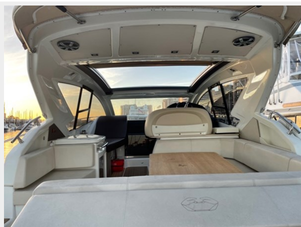
10_2015 44ft Cranchi M 44 HT BULA