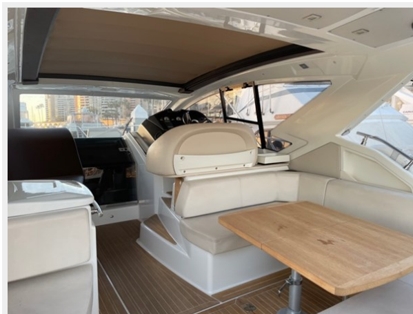
9_2015 44ft Cranchi M 44 HT BULA