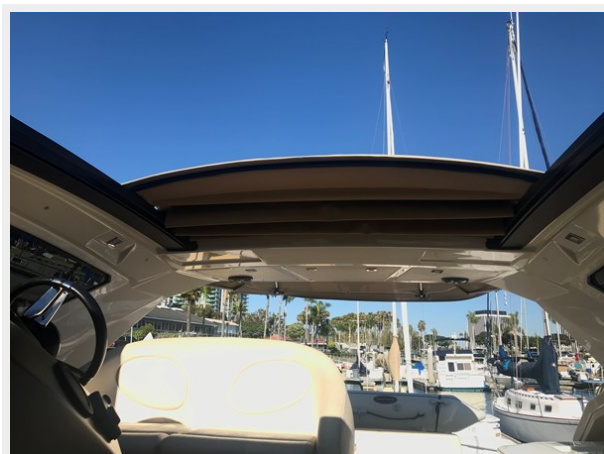
17_Retractable Sunroof 2