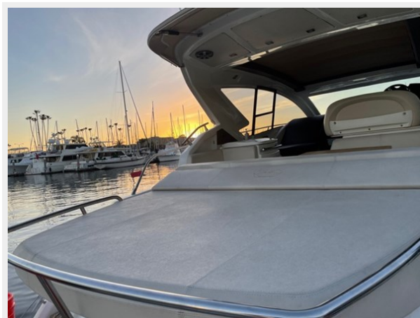
11_2015 44ft Cranchi M 44 HT BULA