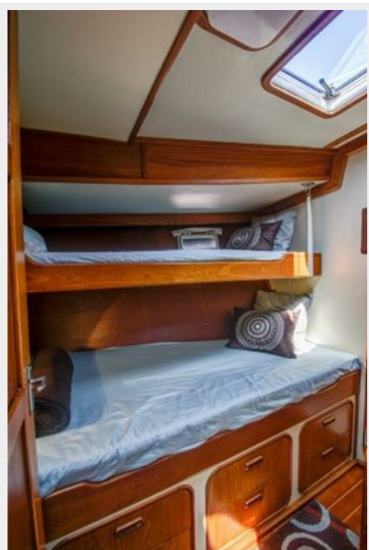
GUEST CABIN 1, PORTSIDE