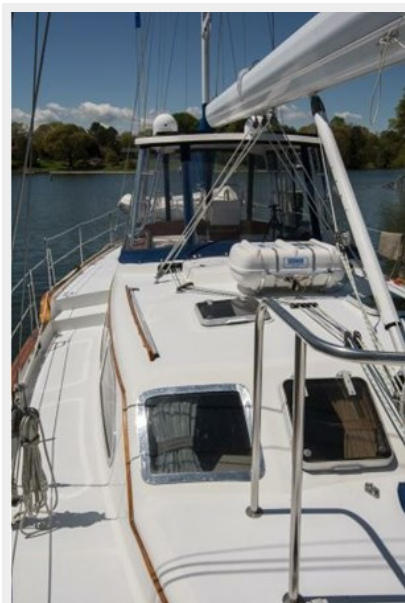
HARDTOP AND ENCLOSURE