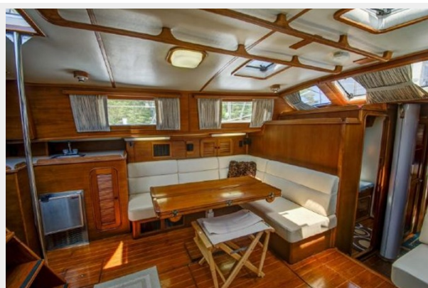
PORT SIDE MAIN SALOON