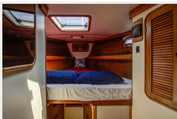
GUEST CABIN 2 FWD