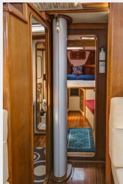
VIEW FORWARD FROM SALOON