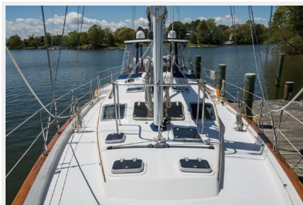
DECK VIEW AFT