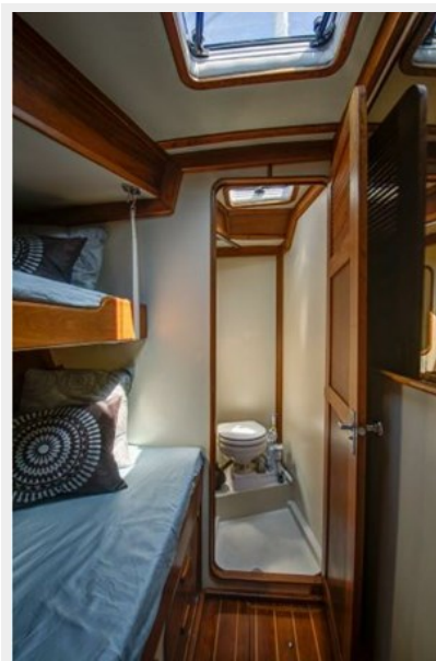
GUEST CABIN W/HEAD, FWD