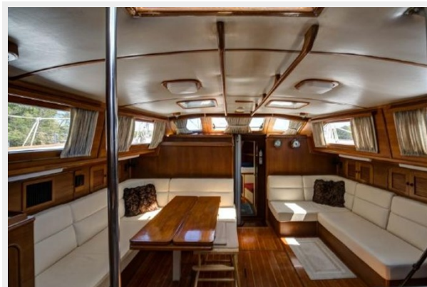
MAIN SALOON FWD