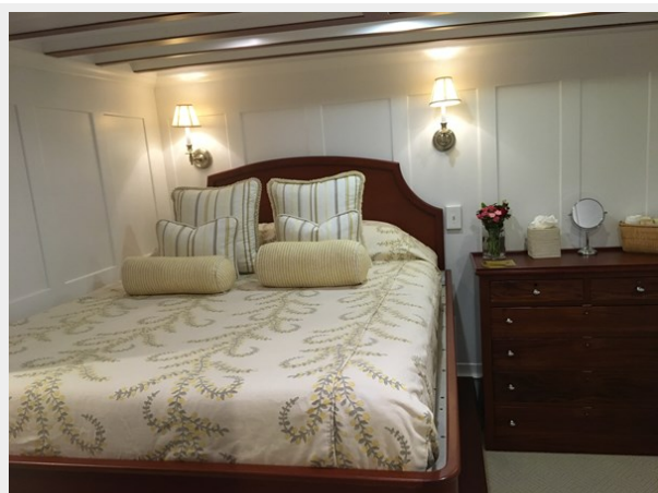
Guest Queen Stateroom