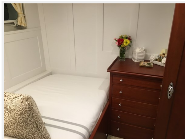
Guest Double Stateroom