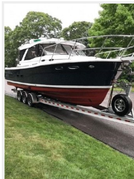
Boat and trailer