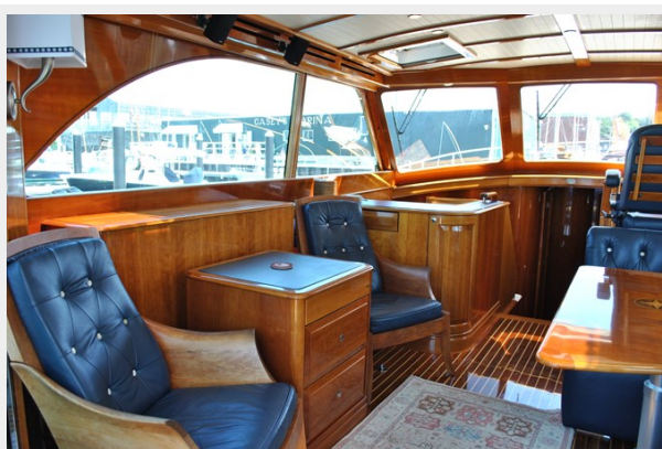
Salon Looking Toward Galley