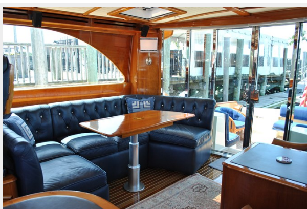
Salon Looking Aft