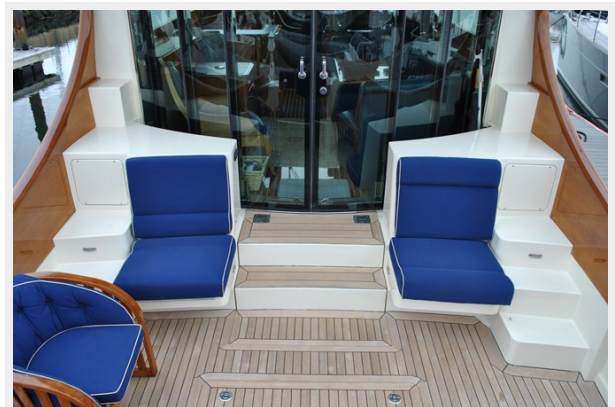
Aft Deck with Sliding Doors