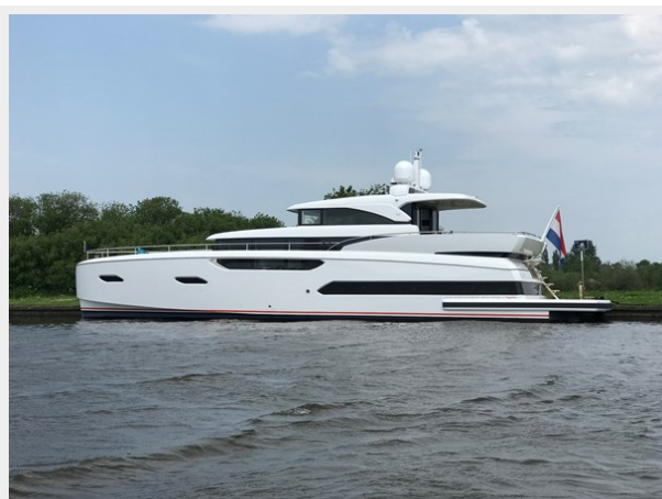
JE62B01 - image launch & trail- (8)