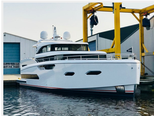
JE62B01 - image launch & trail- (3)