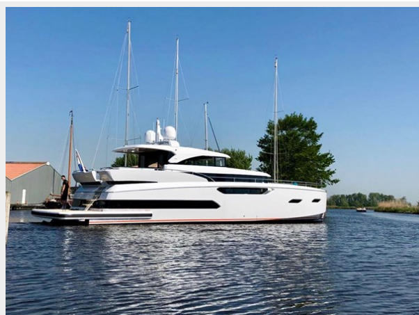
JE62B01 - image launch & trail- (1)