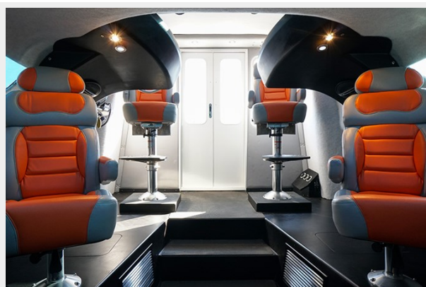
Cabin Looking Aft