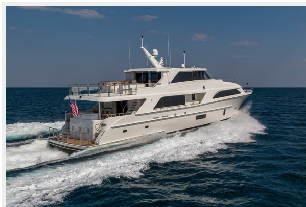
Cheoy Lee 104_0160 LR