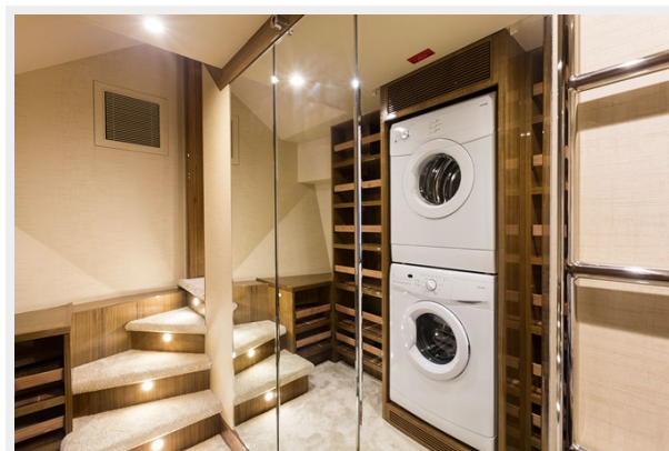
master lower MR