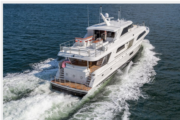
Cheoy Lee 104_0391 LR