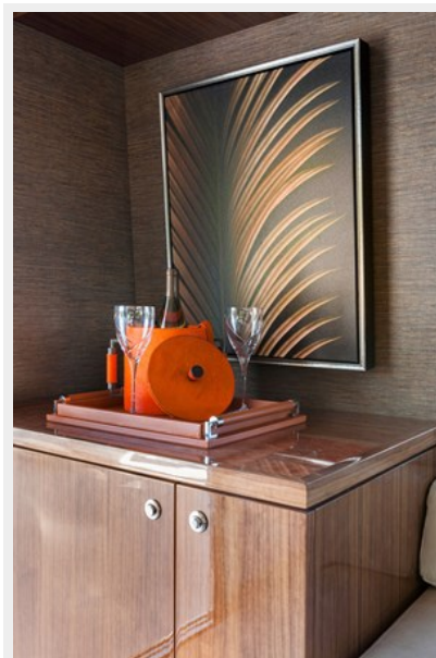
bar top MR