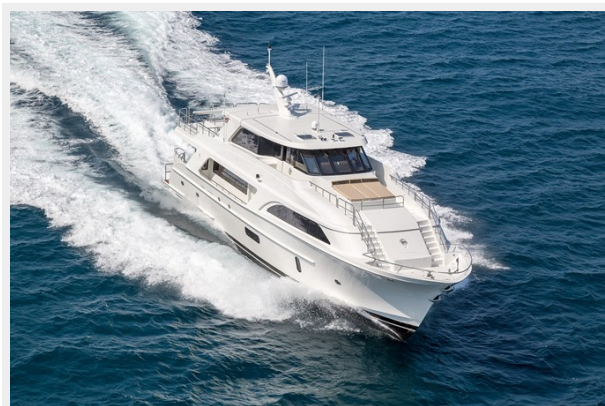
Cheoy Lee 104_0193 LR