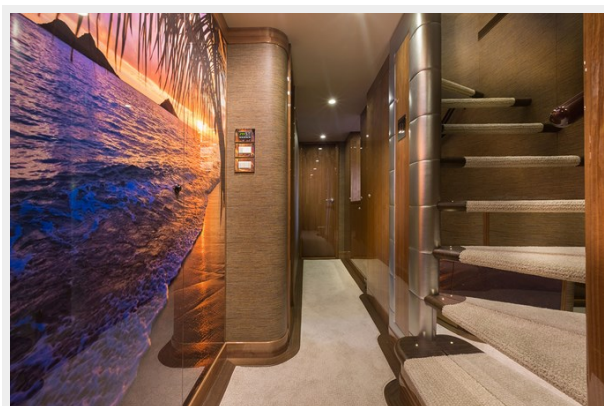
stairway from lower deck 2 MR