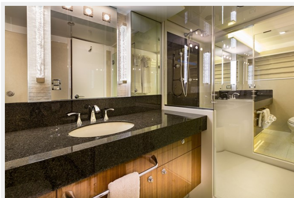
master head MR