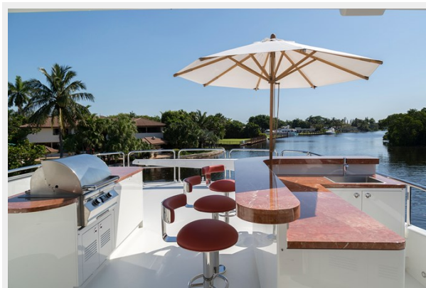
Upper Sundeck aft