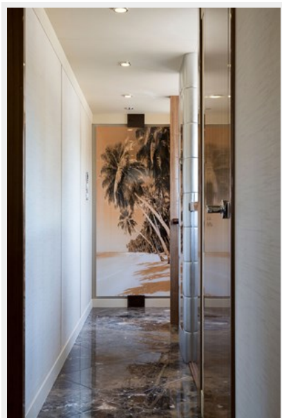
hallway to master MR