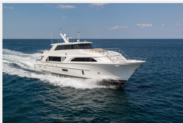
Cheoy Lee 104_0106 LR