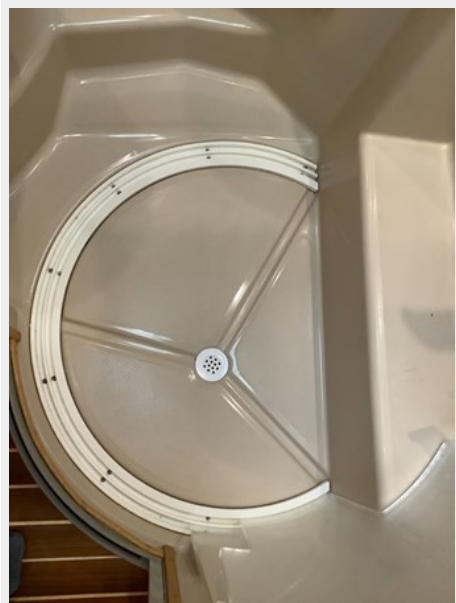
17 Head Shower