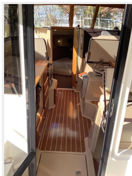
8 Centerline Door