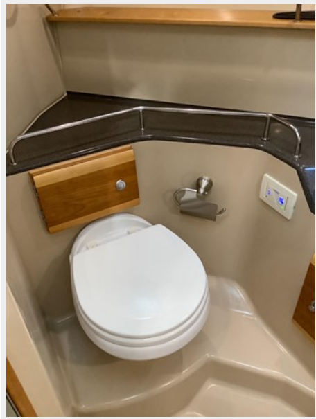
15 Head 2