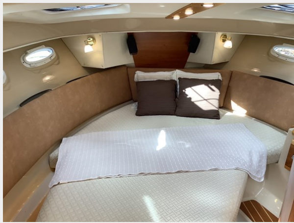
11 Master Stateroom