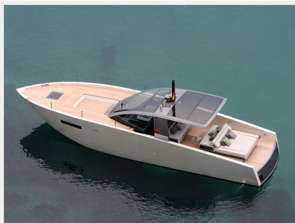
WhatsApp Image 2020-09-03 at 17.15.03 (2)