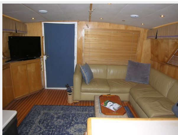
Salon Looking Aft