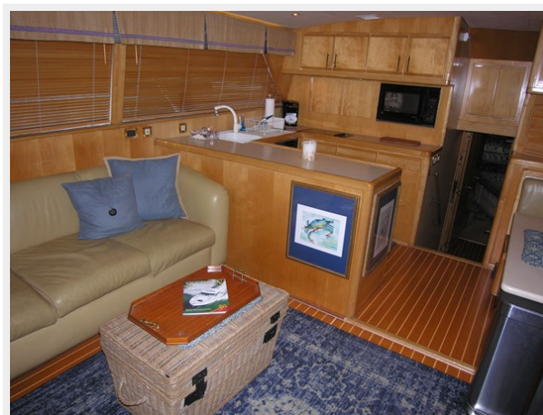
Salon / Galley