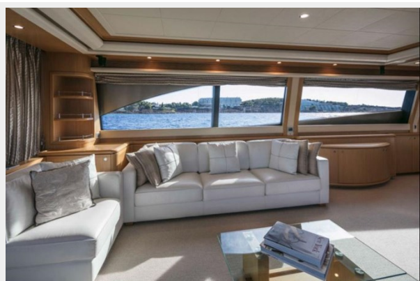
FERRETTI FAIRY LADY SILVIA (3)