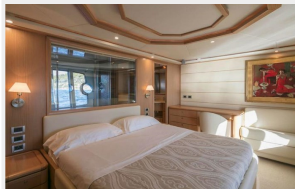
FERRETTI FAIRY LADY SILVIA (6)