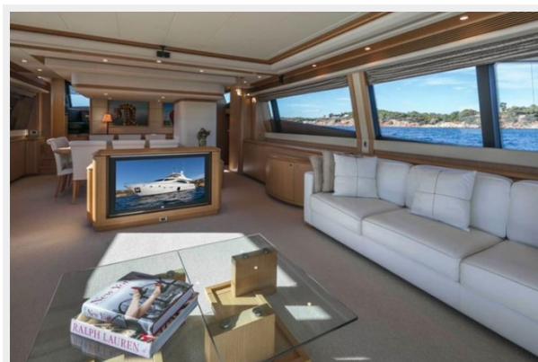
FERRETTI FAIRY LADY SILVIA (2)