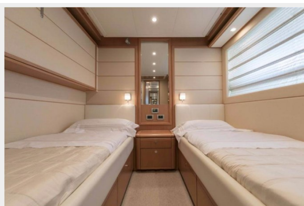
FERRETTI FAIRY LADY SILVIA (7)