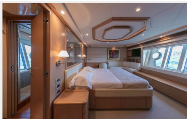
FERRETTI FAIRY LADY SILVIA (5)