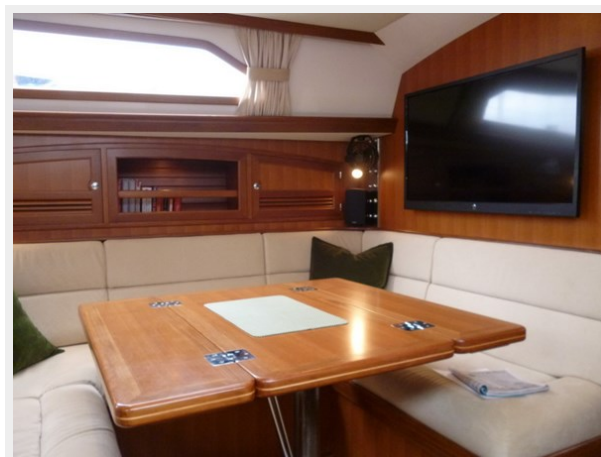
Salon table open