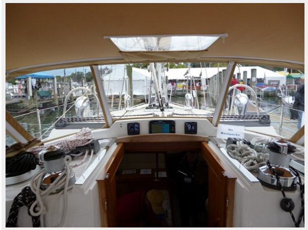
Soft Dodger option