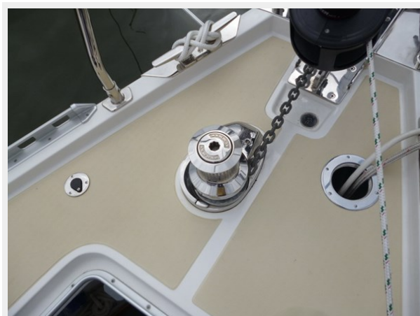
Deck wash down attachment point and windlass