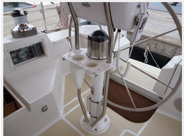
Helm and engine controls