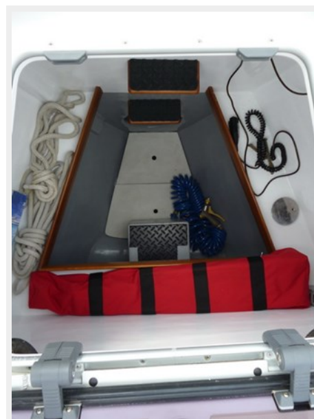
Large bow locker, bow thruster, and watertight bulkhead