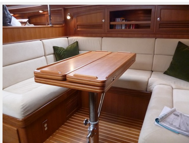
Salon table closed