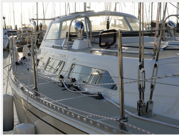
Wide side decks