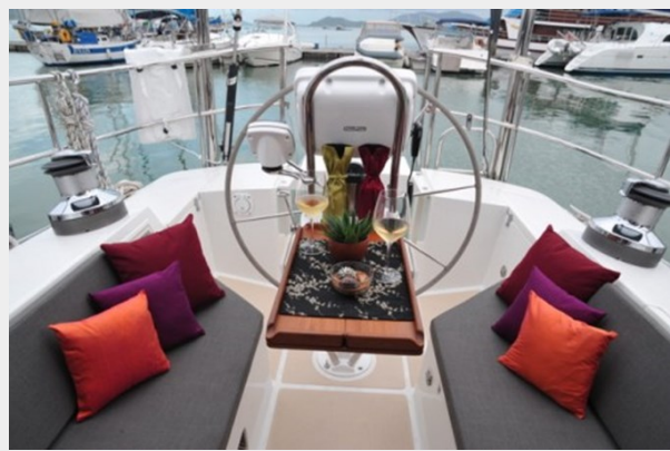
Cockpit with custom cushions