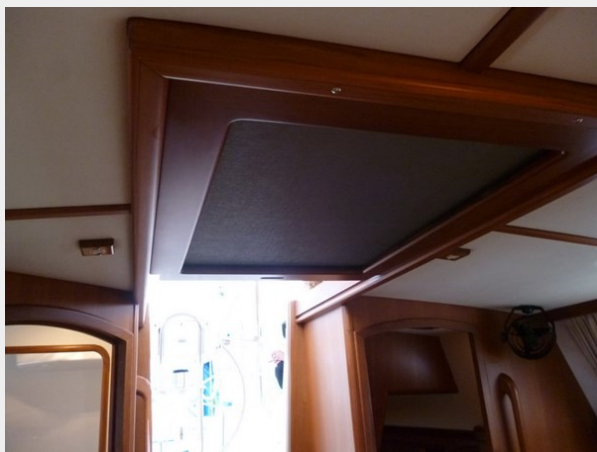
Companionway screen detail