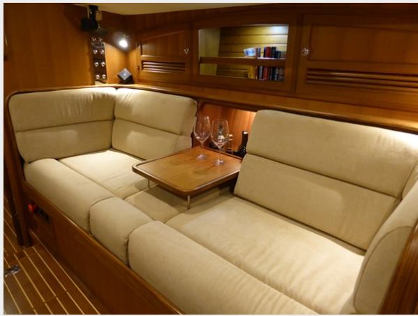
Cocktail table down on starboard settee