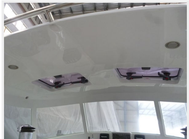
Hatches and LED lights on hard dodger