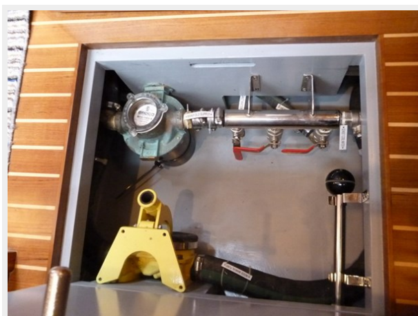
Manual bilge pump and sea water manifold