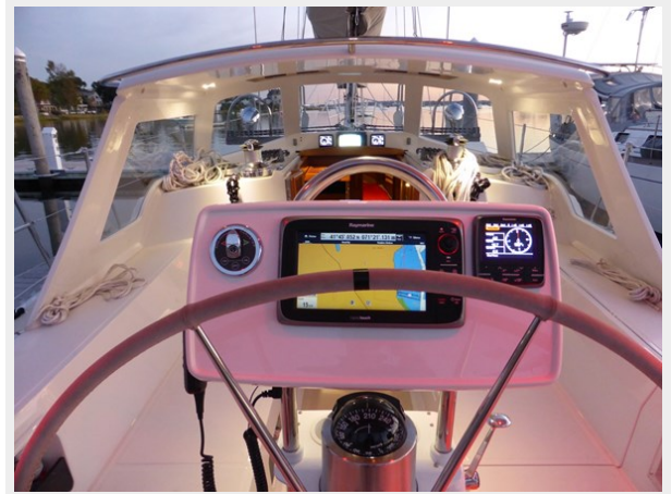
Hard dodger viewed from helm