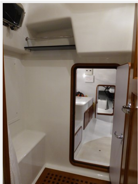
Door to workshop