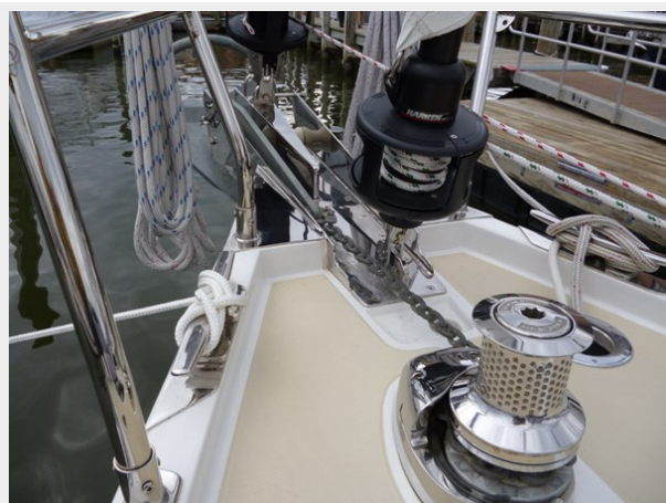
Double bow roller and windlass