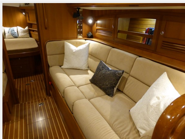
Starboard settee looking forward