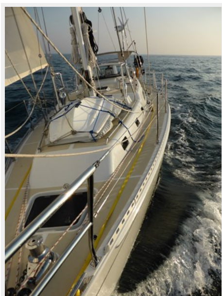
View from bow under sail