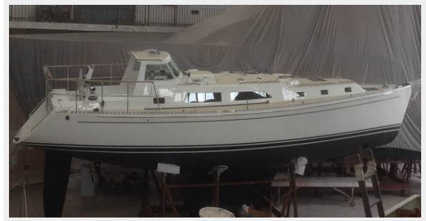
Outbound46 with hard dodger before leaving factory