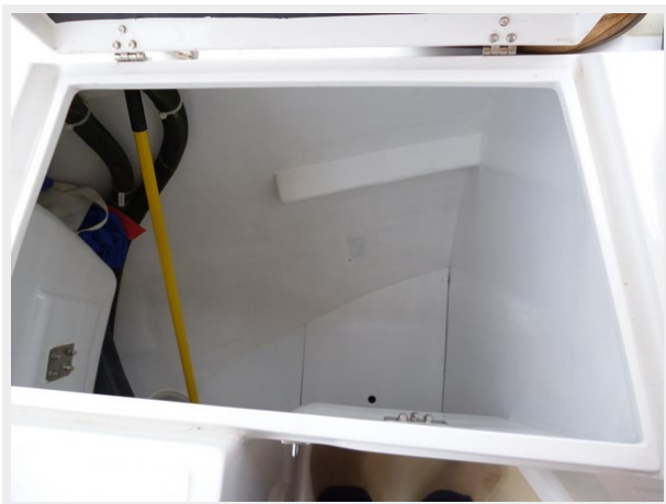
Aft port locker