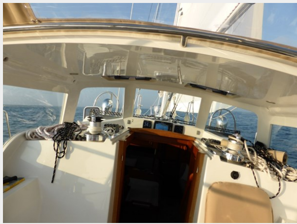
Sightline through hard dodger under sail