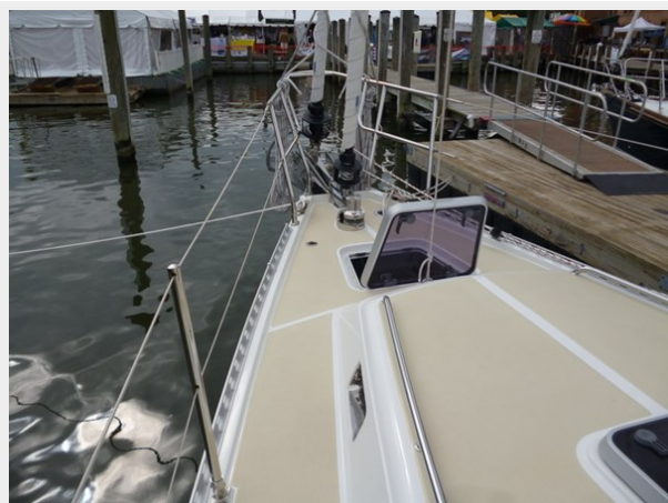
Recessed forward deck hatch