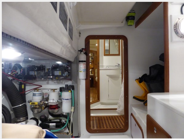
View forward in workshop