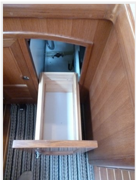
Slide out trash in galley