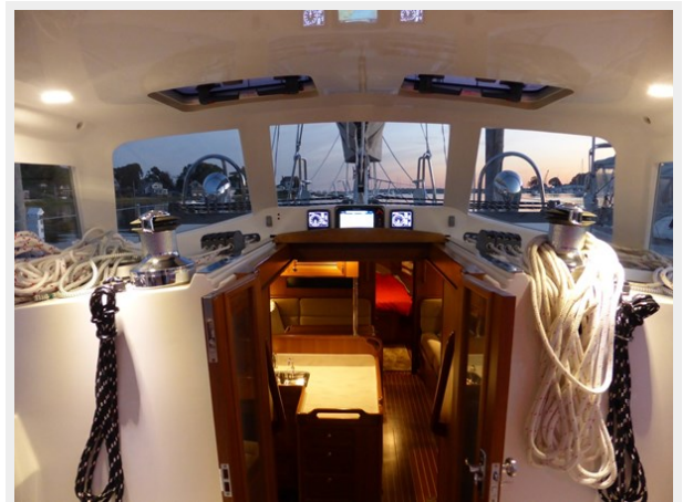
LED lights under hard dodger