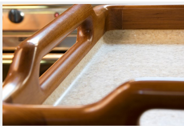
Hand hold in fiddle and counter detail