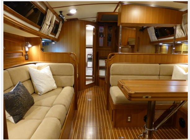
Salon looking aft