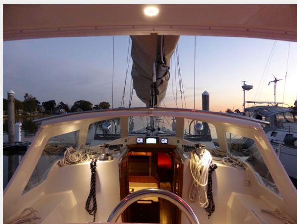
Hard dodger at dusk