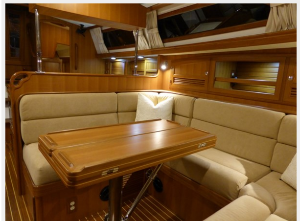
Port settee looking aft