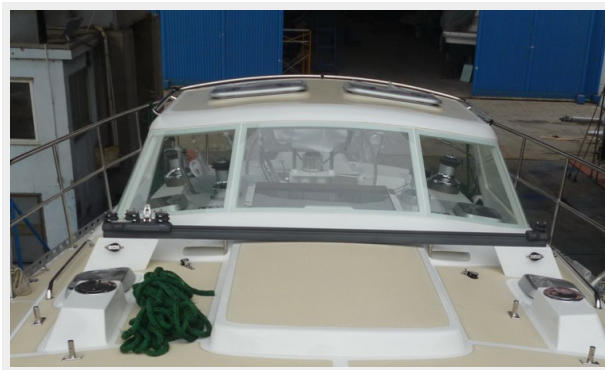
Hard Dodger at factory