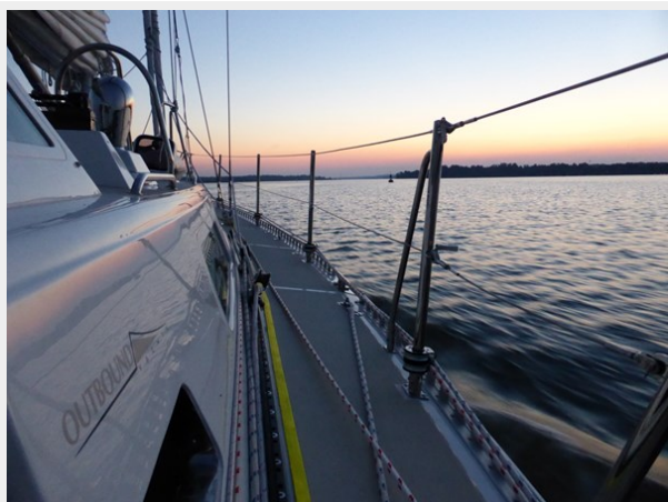
Red skies at night sailors delight