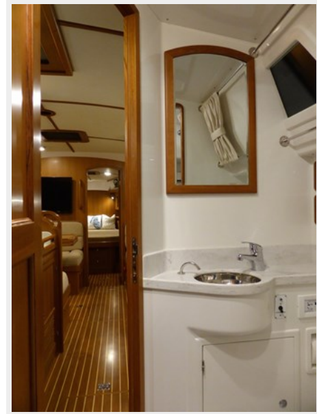
Sink in aft head