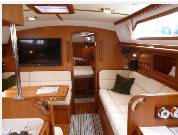
Salon looking forward