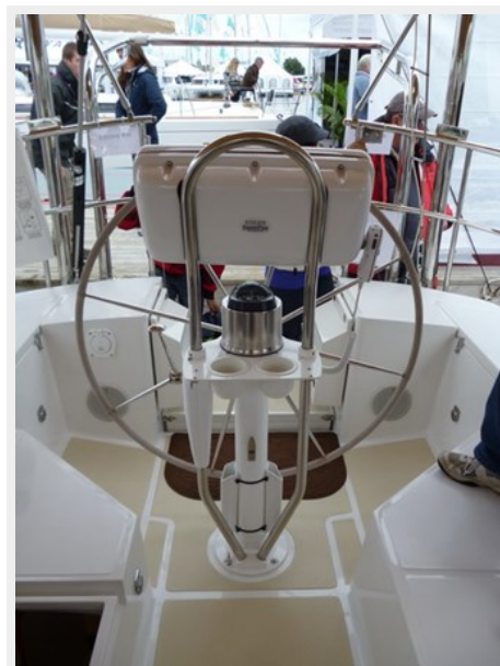
Helm looking aft