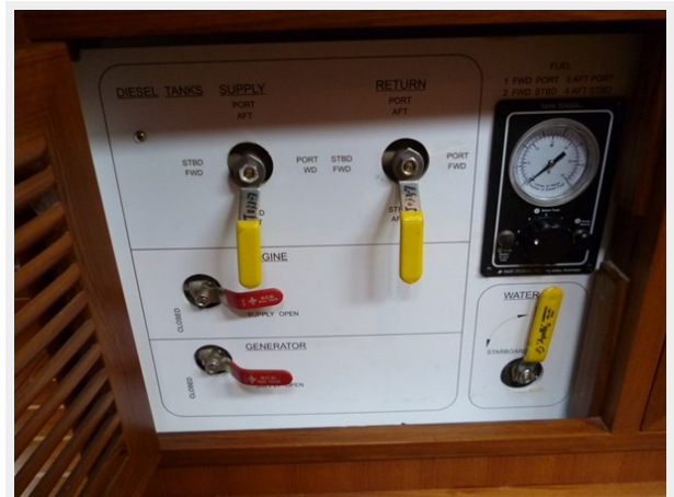
Fuel and water manifolds