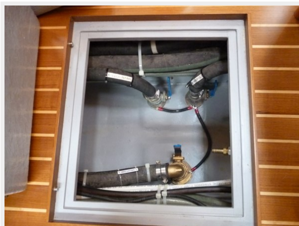
Thru hulls at companionway