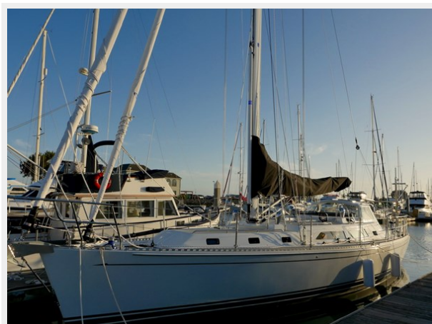
At the dock