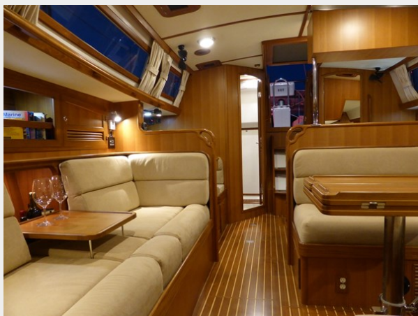
Salon looking aft with cocktail table down