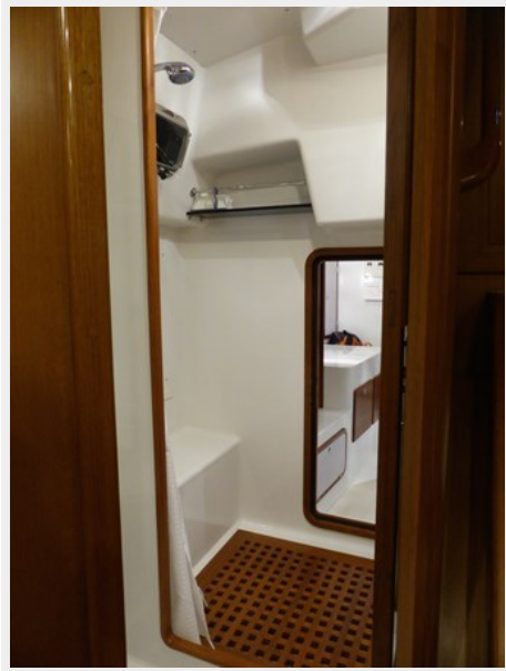
Aft shower and door to work shop