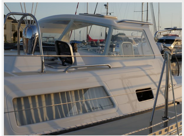
Handholds on hard dodger