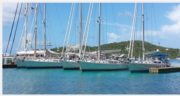
Five Outbound 46's in BVI - Salty Dawg Rally