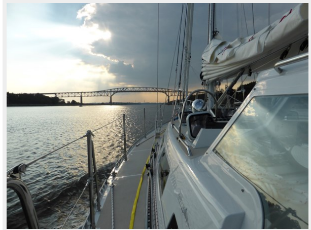
Hard dodger and side deck at dusk