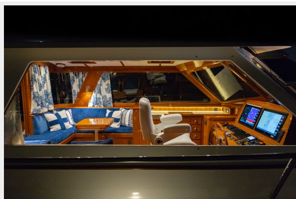
Helm and Salon