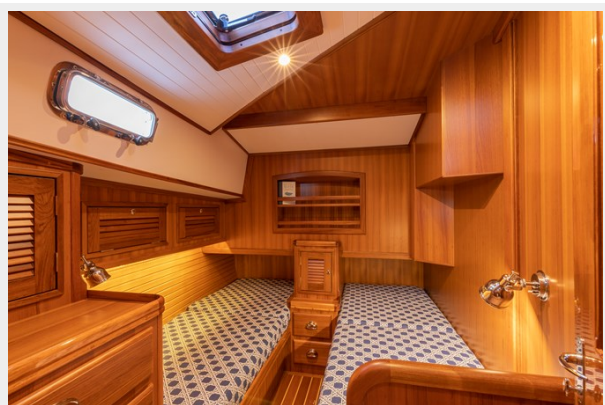
Guest Twin Cabin