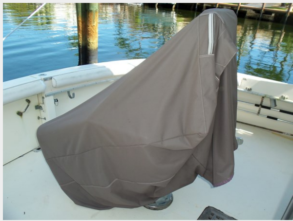
Murray Brothers Fighting Chair