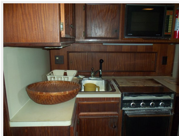
Galley Looking to Starboard