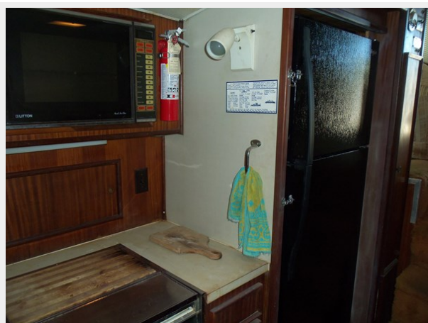
Galley Looking Aft