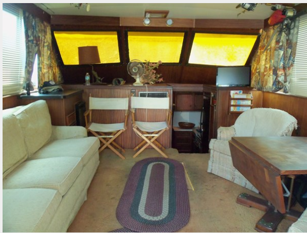
Salon Looking Forward