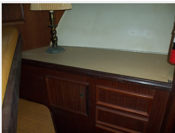
Forward Cabin Starboard Side