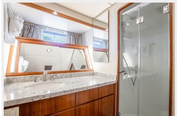
Port Guest Cabin Bath