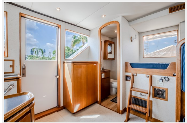
Dayhead in Pilothouse