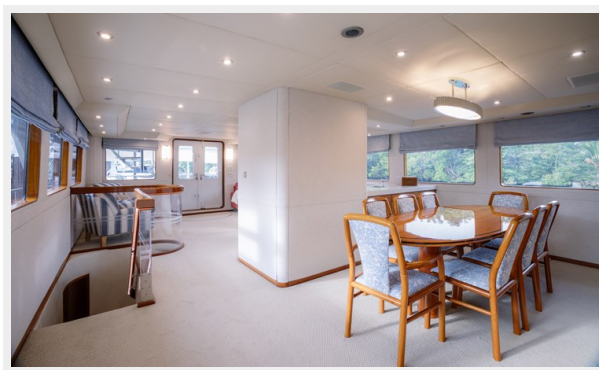
Dining Room Looking Aft