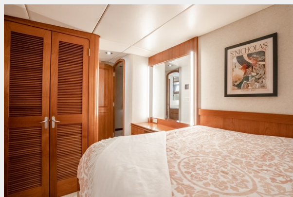
Port Guest Cabin