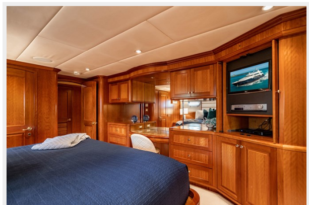
King Guest Stateroom