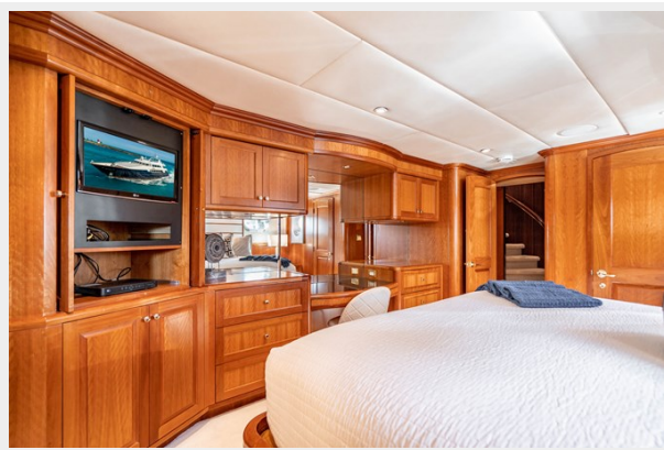
Queen Guest Stateroom