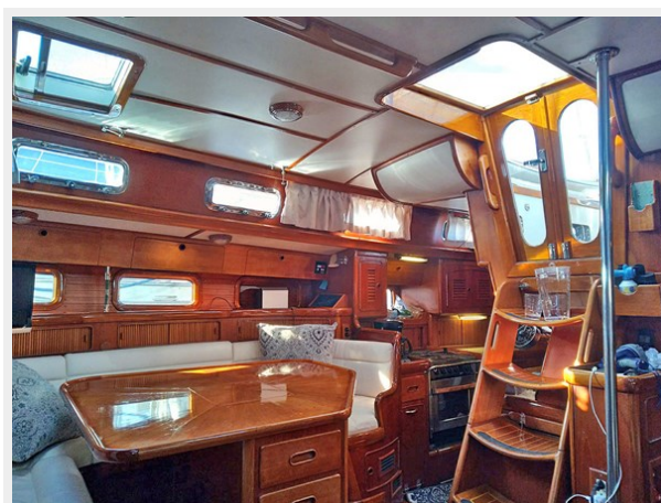
Salon, Stbd. Aft, to Galley