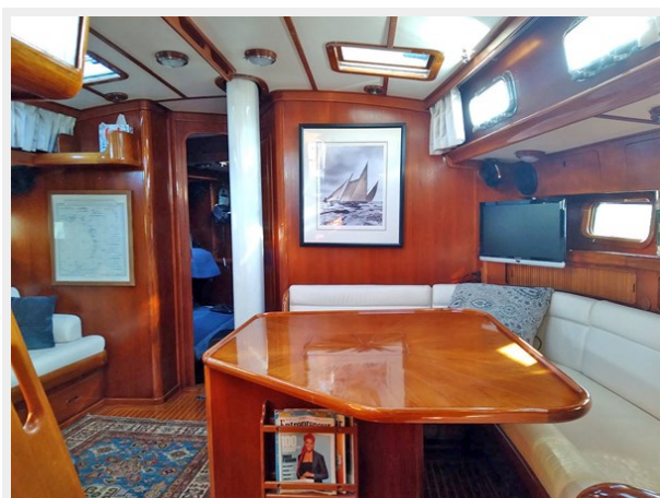
Salon, Stbd., Fwd.