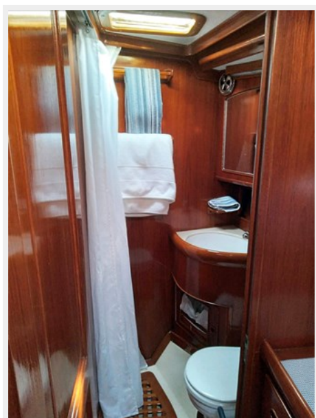
Guest Head and Shower