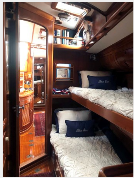
Port Fwd. Stateroom, Looking Aft